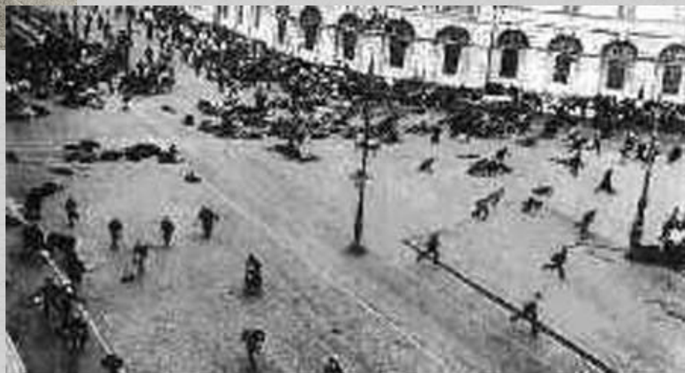
Расстрел демонстрации на Невском 4 июля ст.ст 1917 г.