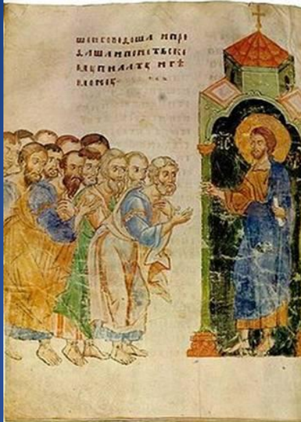
Отослание апостолов на проповедь. Миниатюра из Сийского Евангелия 1339 г. – древнейшей московской рукописи.