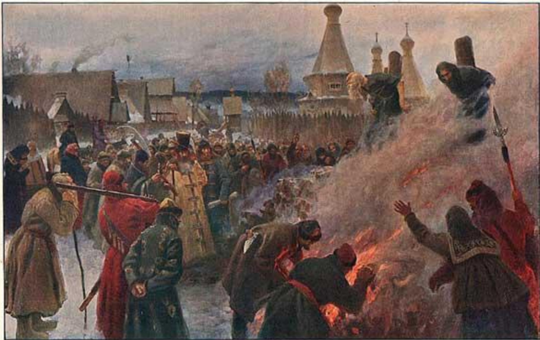
П. Мисофдовъ. Сожженію протопопа Аввакума. Музей Владимірскаго Лаврскіа Художества.