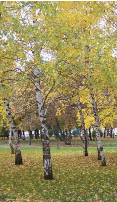
светлые (мелколиственные береза, осина),

В XIX веке российские леса в зависимости от видового состава деревьев классифицировались следующим образом: