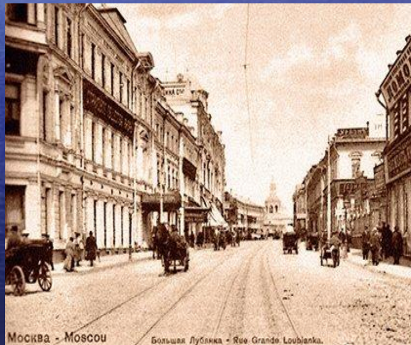
Москва - Moscow