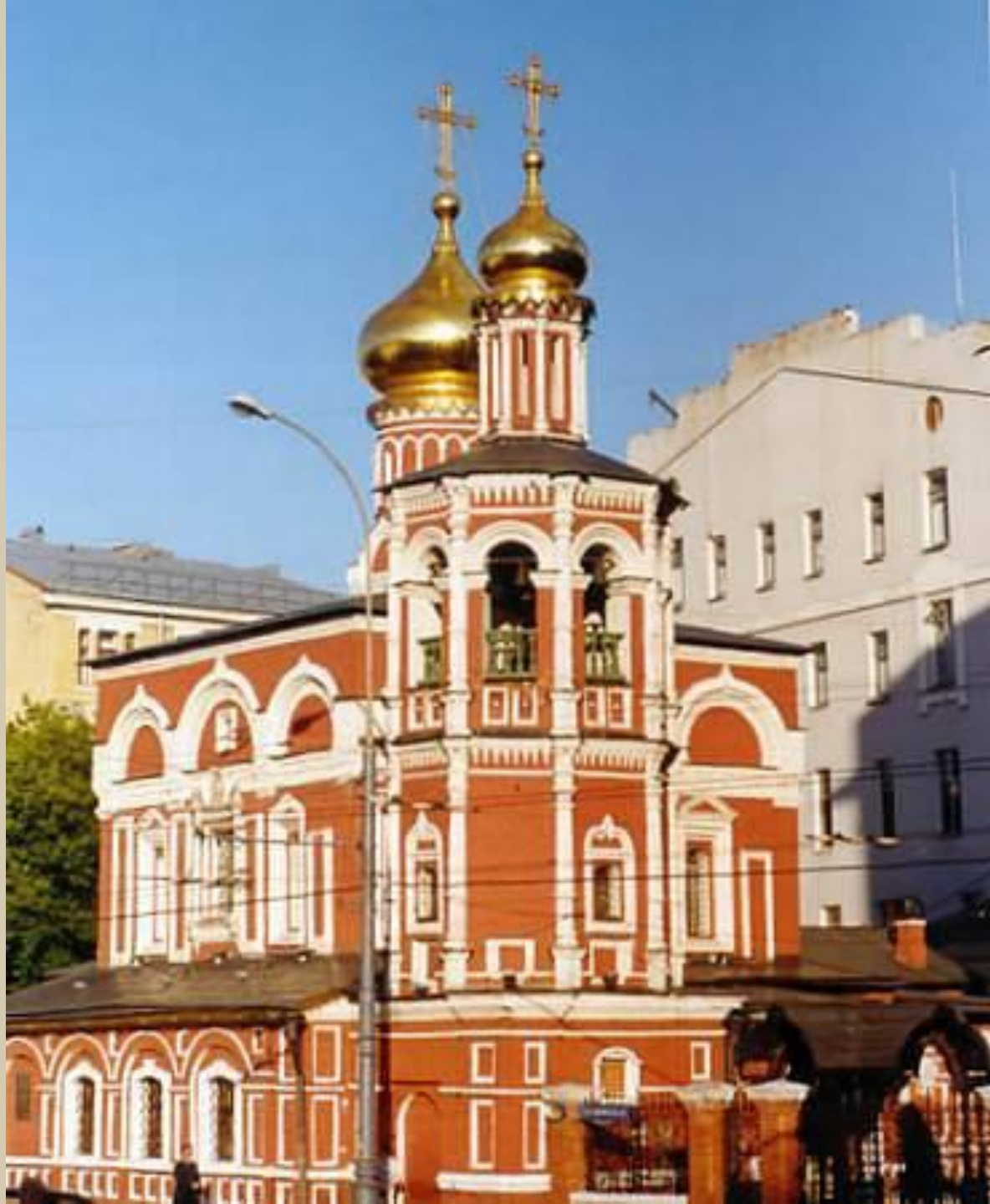
Церковь Всех Святых на Кулишках