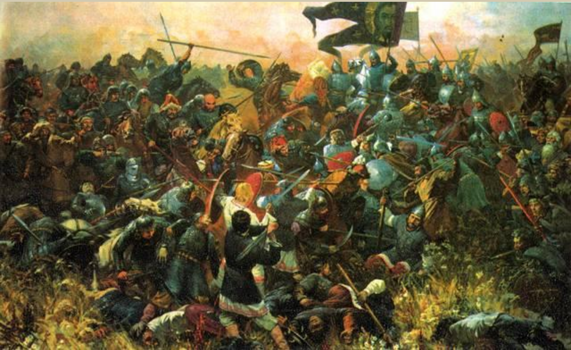
Присекин С. Куликовская битва