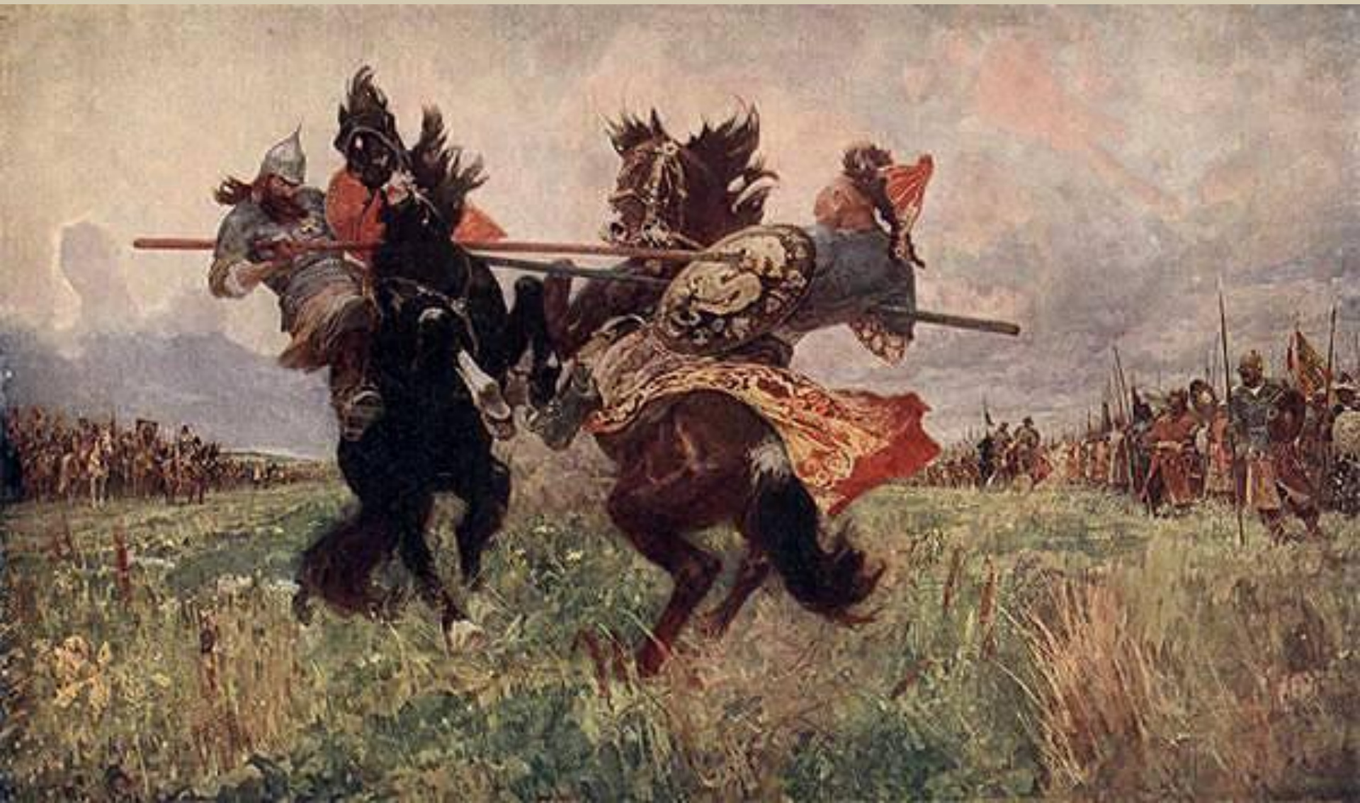
Авилов В. Поединок Пересвета с Челубеем