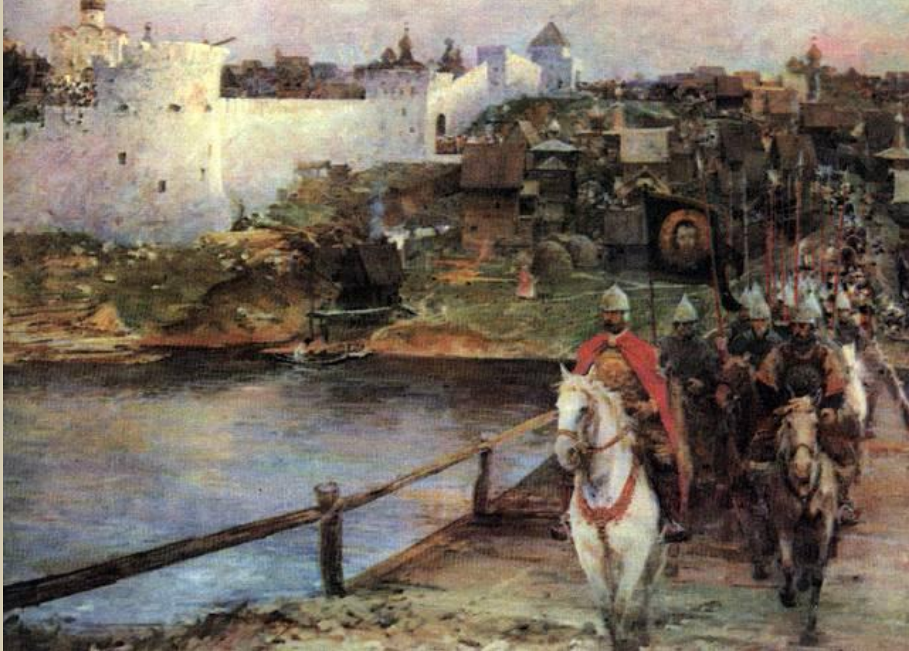
Данилевский Е. К полю Куликову