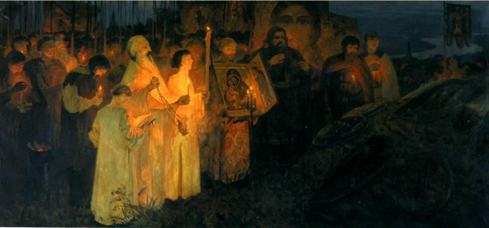
Андряка С. Вечная память. На поле Куликовом.