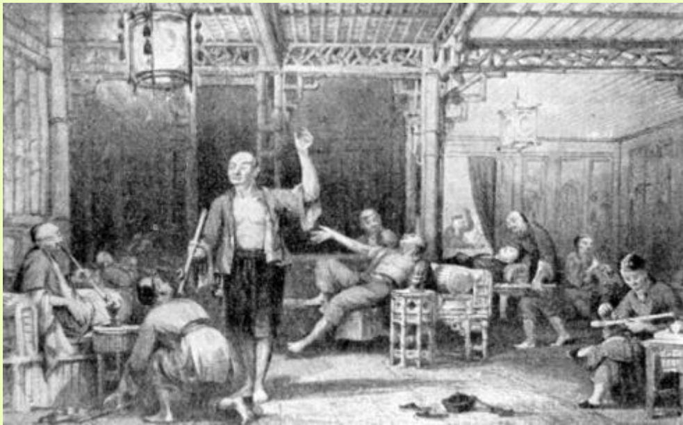
Курильщики опиума. Гравюра Дж. Патерсона по рисунку Т. Аллома.