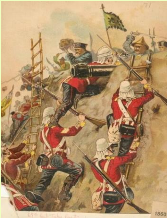
67-й пехотный полк штурмует форт

ИТОГ: Китай потерпел полное поражение в этой войне.