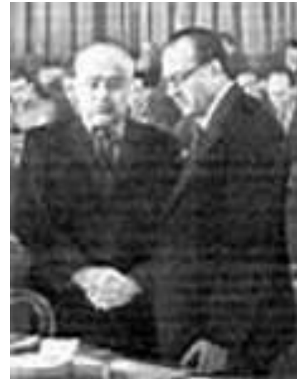
Первый президент ГДР О. Гротеволь и В.Пик

7 октября 1949г. – провозглашение создания Германской Демократической Республики на территории Восточной Германии.