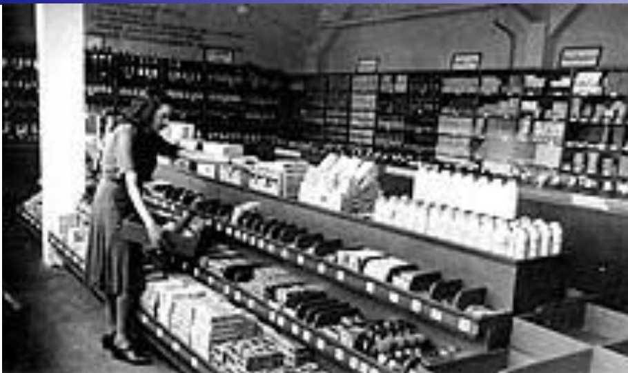
Первый магазин самообслуживания, Аугсбург, 1949г.