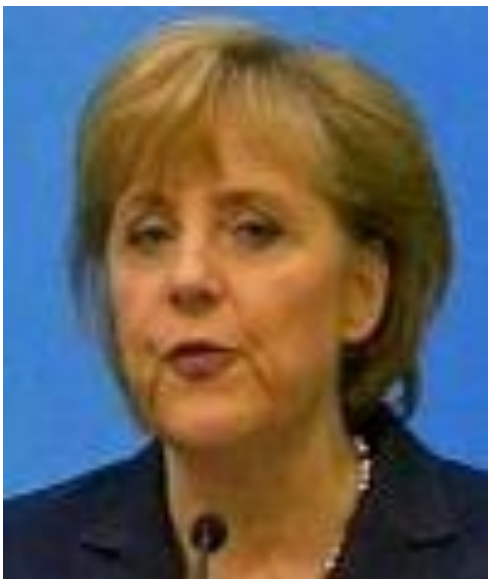
Ангела Меркель, Федеральный Канцлер Германии с 2005г.

В наши дни, Германия - одна из наиболее развитых держав мира. По уровню экономического и промышленного развития германия занимает 3е место в мире. Самой огромной проблемой страны на протяжении более чем 50-и лет остается высокий уровень безработицы, «тормозящий» развитие экономики.