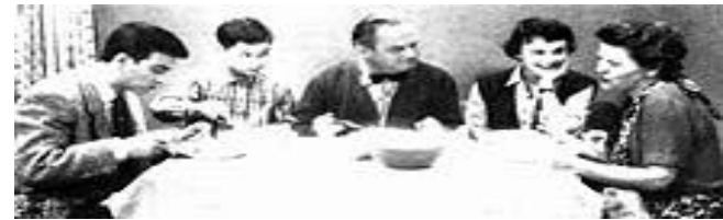
Первый немецкий сериал «Семейство Шелерман», 1954г.