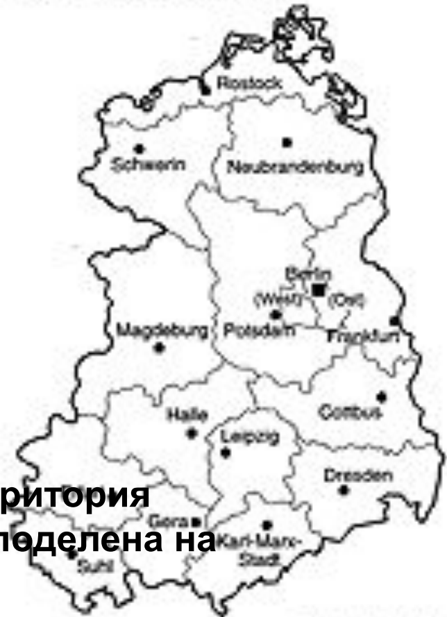
Gliederung der DDR Bezirksgrenzen (seit 1952)

В 1952г территория ФРГ была поделена на округа.