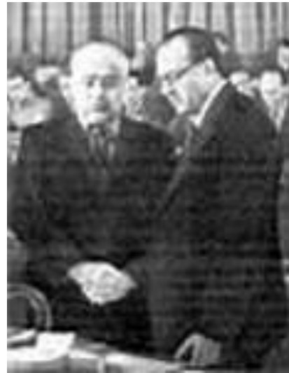
Первый президент ГДР О. Гротеволь и В.Пик

7 октября 1949г. – провозглашение создания Германской Демократической Республики на территории Восточной Германии.