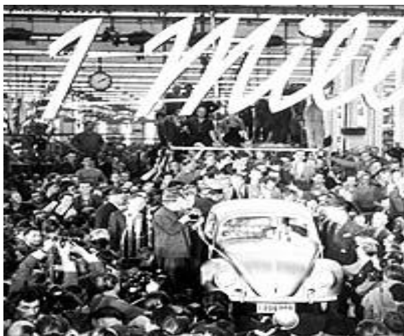
Миллионный «Фольксваген – жук», 1955г.