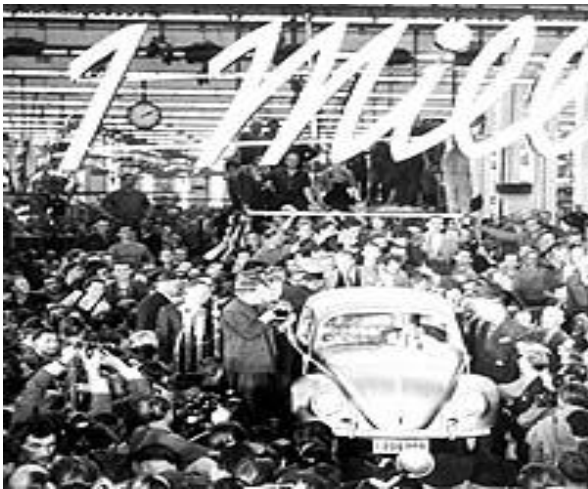
Миллионный «Фольксваген – жук», 1955г.