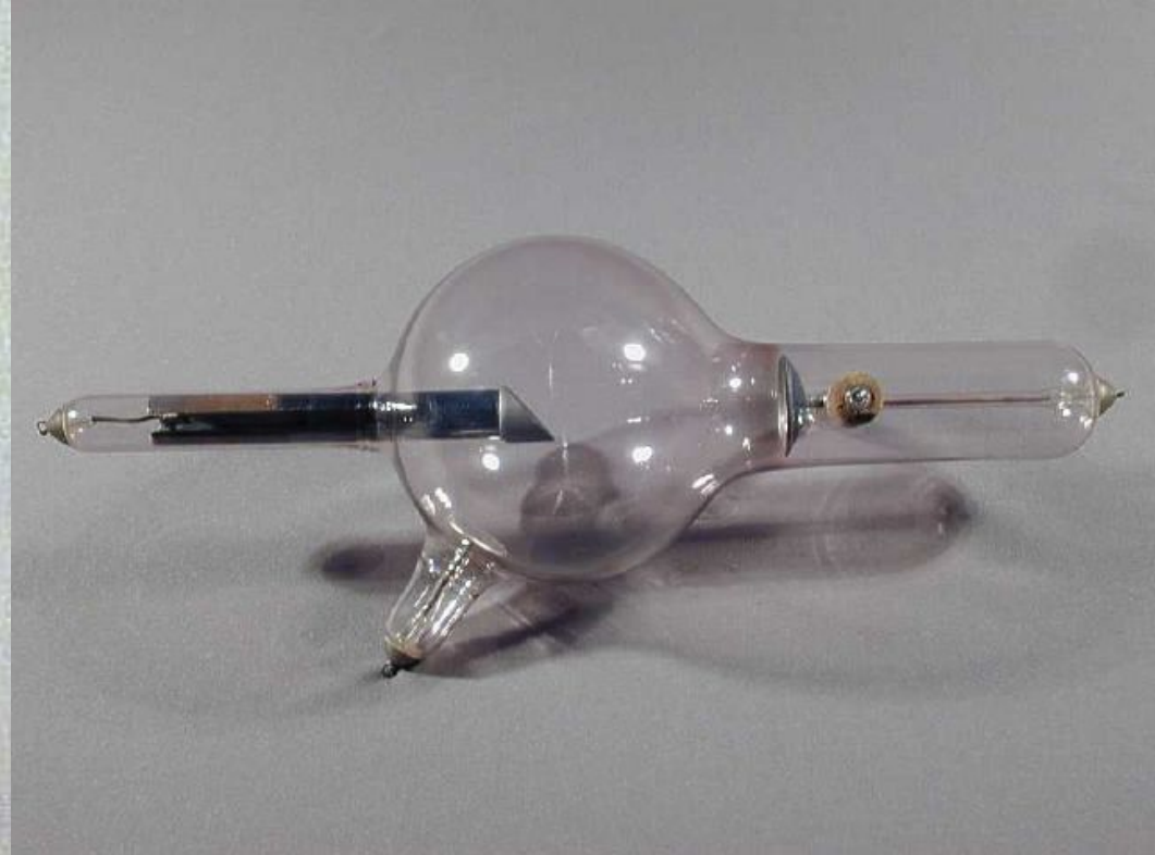
Одна из первых рентгеновских трубок