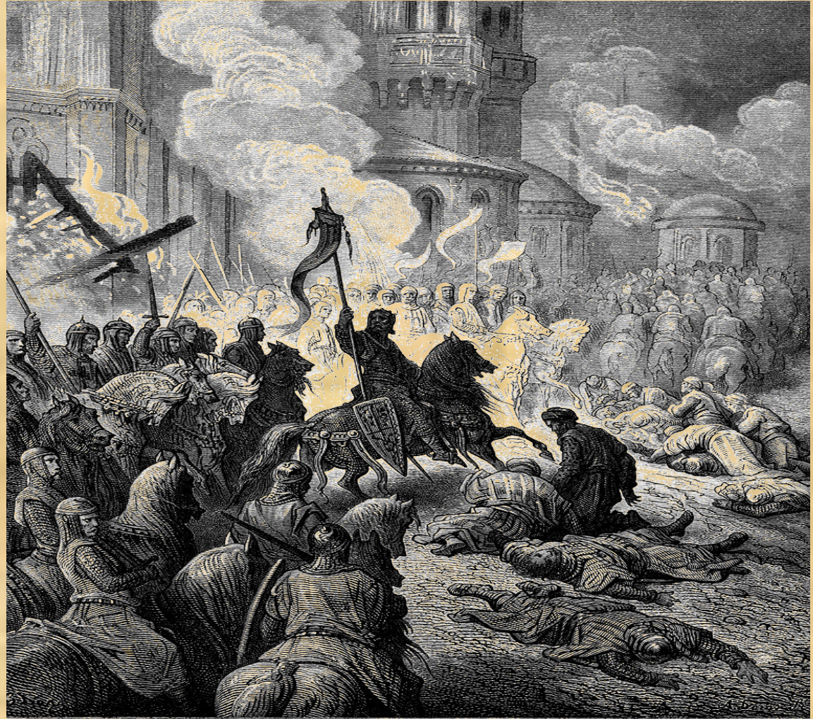
50. Entry of the Crusaders into Constantinople The Crusaders invade Constantinople, killing everyone they encounter, setting fire to the city and frightening the Greeks into retreating.