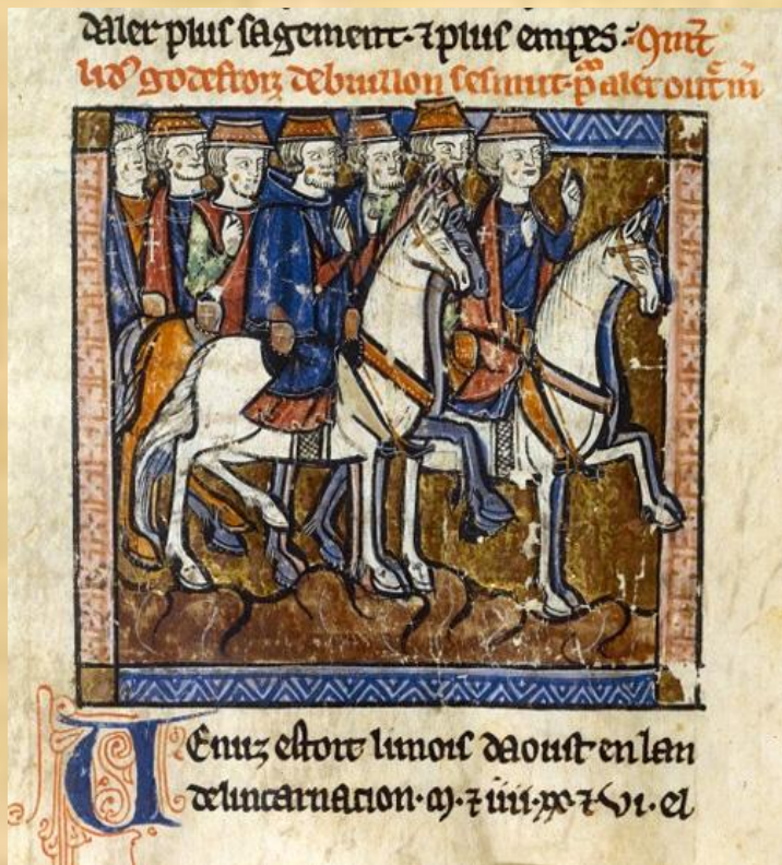
Отбытие крестоносцев из Европы

Осенью 1096 в путь двинулось рыцарское ополчение из разных частей Европы, вождями его были Готфрид Бульонский, Раймунд Тулузский и др. К концу 1096 — началу 1097 они собрались в Константинополе, весной 1097 переправились в Малую Азию, где совместно с византийскими войсками начали осаду Никеи, взяли ее 19 июня и передали византийцам.