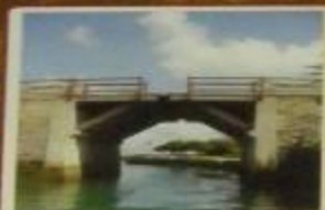
Подъемный мост через ров с водой