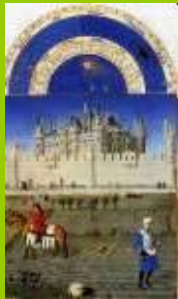
Календарь герцога Беррийского