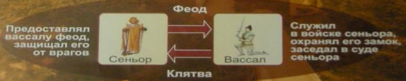
1. Вассальная пирамида VIII – XIV века

Вассал моего вассала – не мой вассал (Франция) Вассал моего вассала – мой вассал (Англия)