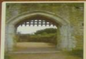
Ворота с решеткой