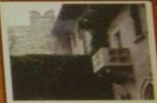
Верхний двор с домом хозяина