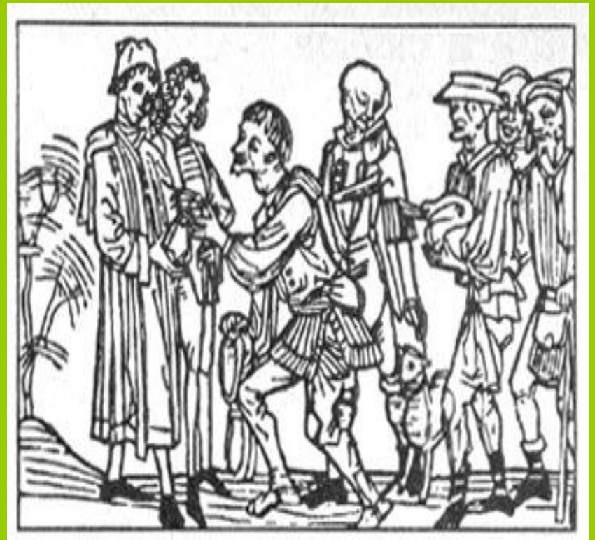
Крестьяне на оброке

За пользование землей зависимые крестьяне должны были нести повинности. Главными повинностями были барщина и оброк