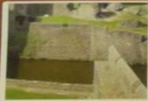
Ров с водой