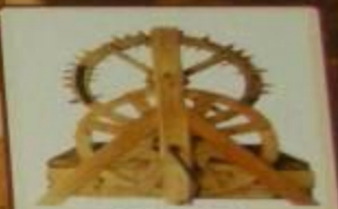
Колодец с механизмом