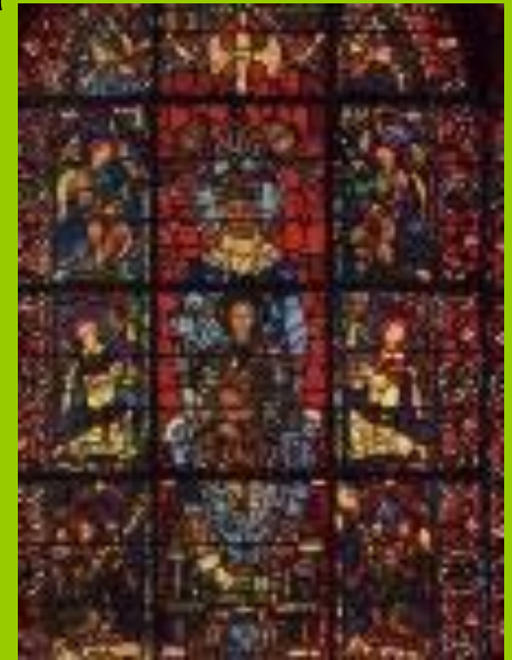
Витраж собора в Шартре