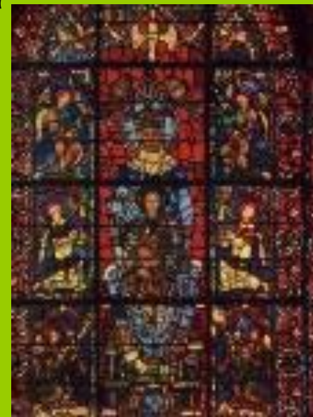
Витраж собора в Шартре