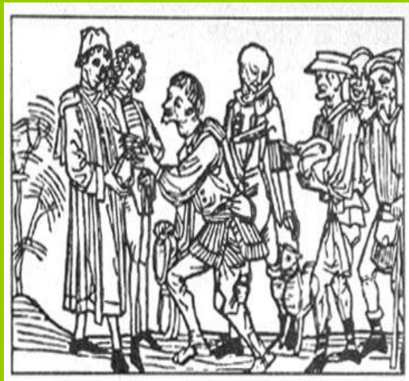
Крестьяне на оброке

За пользование землей зависимые крестьяне должны были нести повинности. Главными повинностями были барщина и оброк