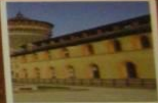
Нижний двор с хозяйственными постройками