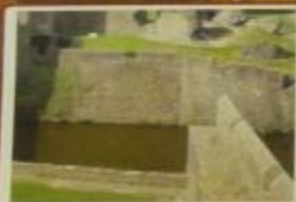
Ров с водой