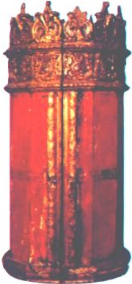
Футляр с Торой

Христос и его первые почитатели были евреями. Среди Еврейского народа в 1 в. до н.э. Распространилось множество различных религиозных сект. Все они почитали священную книгу Древних иудеев-Тору. Среди сект стали появляться слухи о скором установлении царства божьего на Земле.