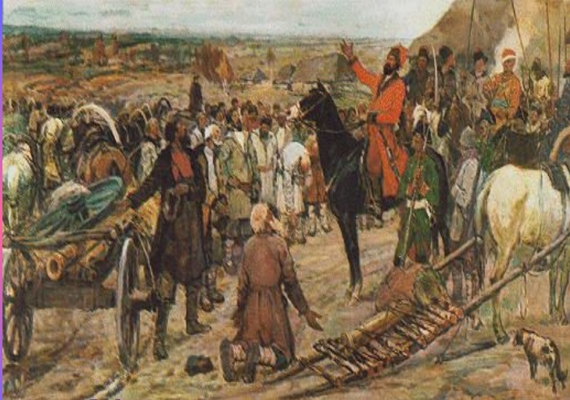
Рабочие уральских заводов привозят пушки Пугачеву