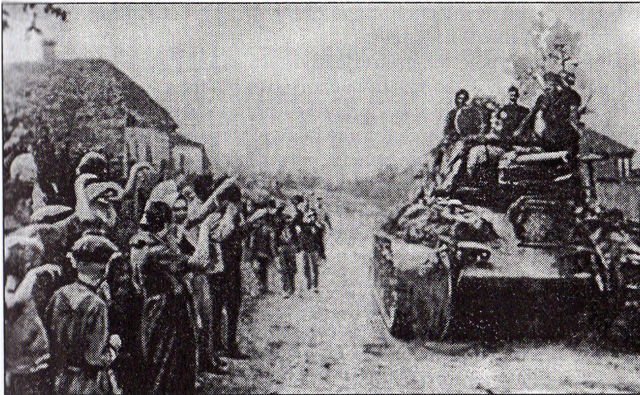
Встреча освободителей. Харьковская область. Август, 1943 г.

В августе силами Степного и Воронежского фронтов была проведена Белгородско- Харьковская операция. В ночь на 23 августа начался решающий штурм, а утром город был освобождён от оккупантов.