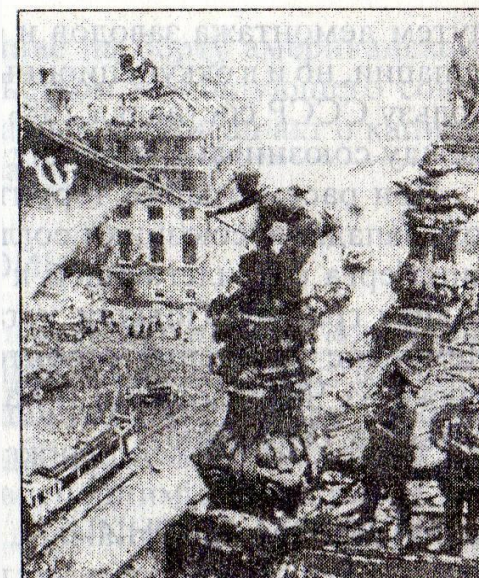
Знамя Победы над рейхстагом