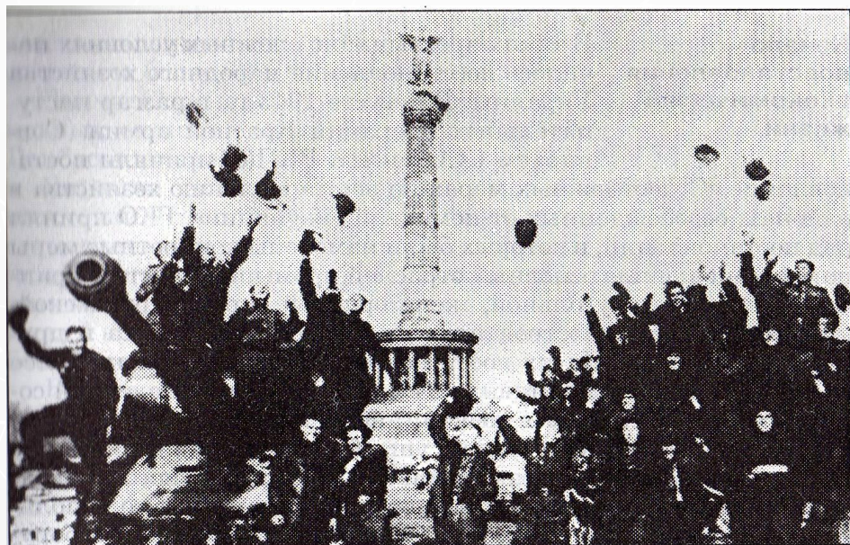
Берлин. Весна 1945 г.

В предместье Берлина Карлгорсте представители немецкого верховного командования подписали акт о безоговорочной капитуляции Германии.