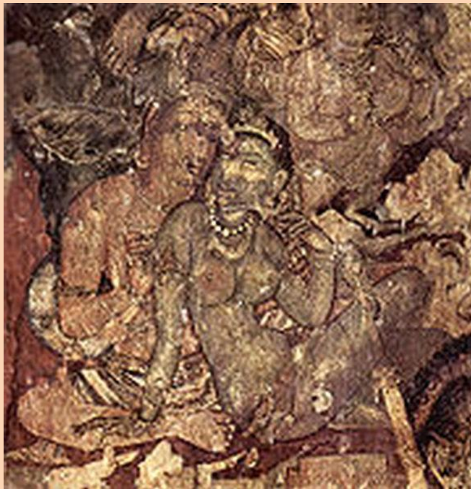
Древняя фреска из Храма Аджанты ( при Гуптах)