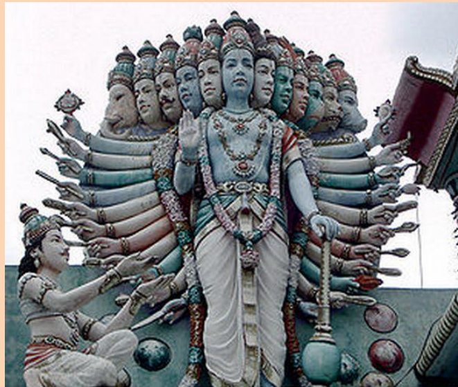
Вишну и 12 аватар - хранитель мироздания