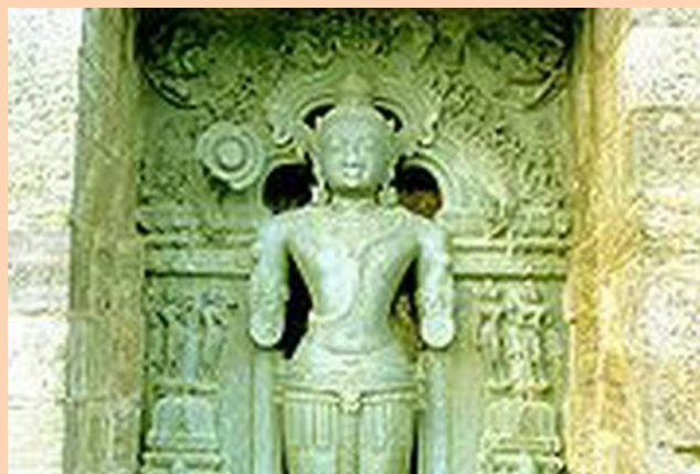
Сурья- бог солнца