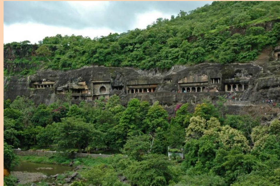
Пещерный храм в Аджанте (империя Гуптов)