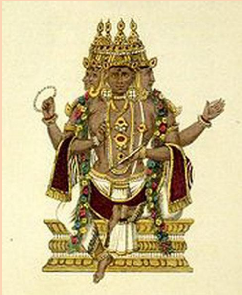
Брахма - создатель

Религия Брахманизм формируется I тыс. до н. э. Это более стройное учение о мире, множество богов сведено к троице . Постепенно брахманизм переходит в индуизм , которая является самой распространенной в Индии религией, охватывая более 80% верующих. Индуизм существует в виде направлений: вишнуизма, шиваизма, кришнаизма . В индуизм включены многие культы через концепцию аватары (воплощений) Вишны. То есть Вишна нисходит в мир, перевоплощаясь в различные образы (принимает облики Рамы, Кришны и Будды). " Бхагаватгита " - священное писание индуизма. Основу индуизма составляет учение о вечном переселении душ ( сансара ), происходящем в соответствии с законом воздаяния (карма) за все содеянное в жизни.