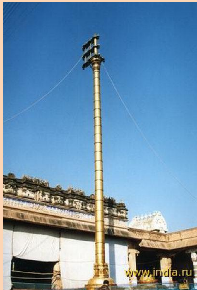
Золотая стамбха – башня со священным животным (500 кг золота)