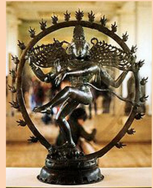
Шива - разрушитель