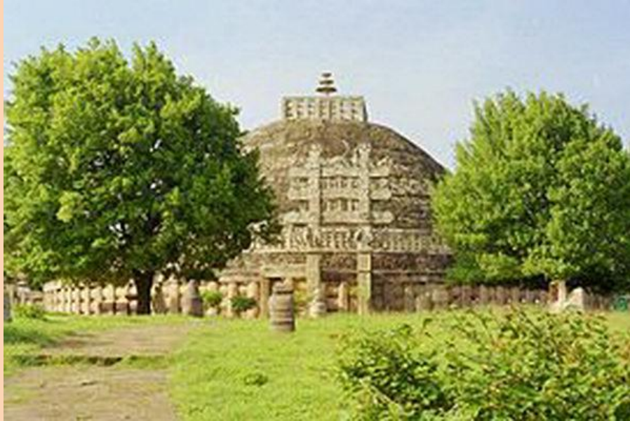
Большая ступа №1 , где хранятся реликвии Будды

Развитие древнеиндийской архитектуры имеет некоторые особенности. Памятники существовавшие до III века до н. э., не сохранились до наших дней, так как строительным материалом служило дерево. С III века до н. э. в строительстве используют камень.