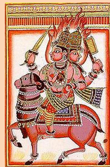
Агни – бог огня