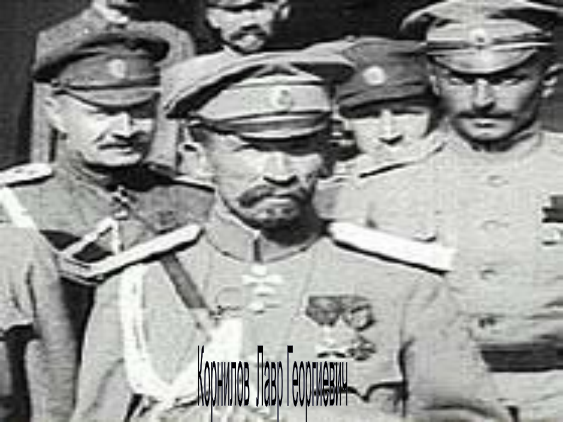
Корнилов Лавр Георгиевич