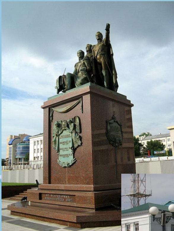
Памятник основателям города Новороссийск.