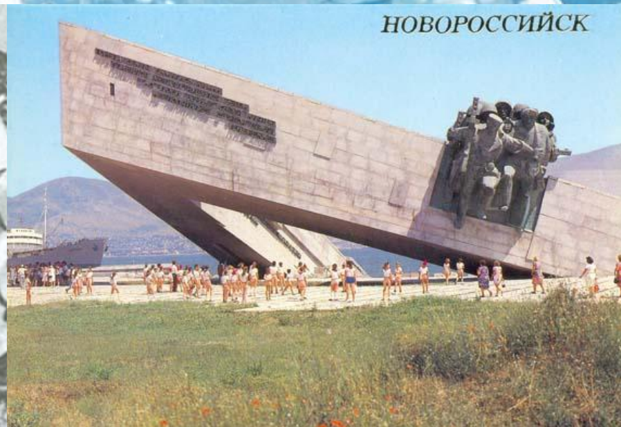
Памятник защитникам Малой земли