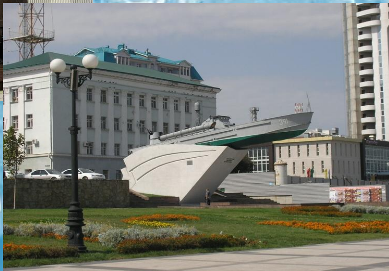
Памятник морякам, защищавшим Новороссийск в годы ВОВ