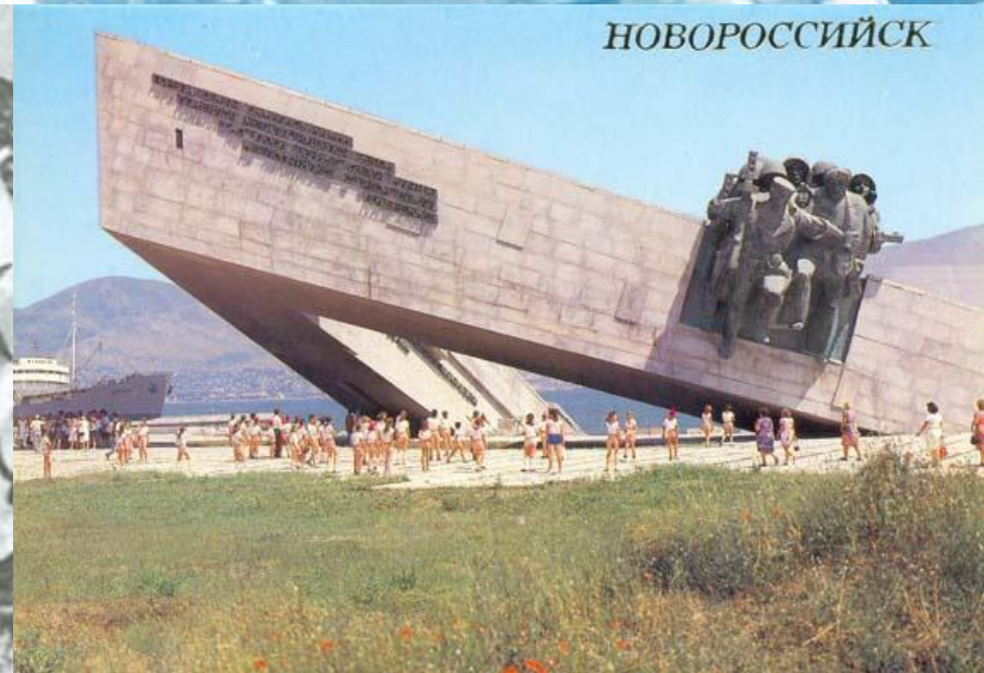
Памятник защитникам Малой земли