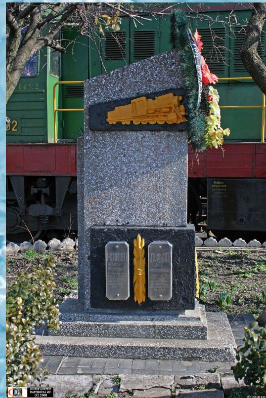
Памятник погибшим в ВОВ железнодорожникам Новороссийск