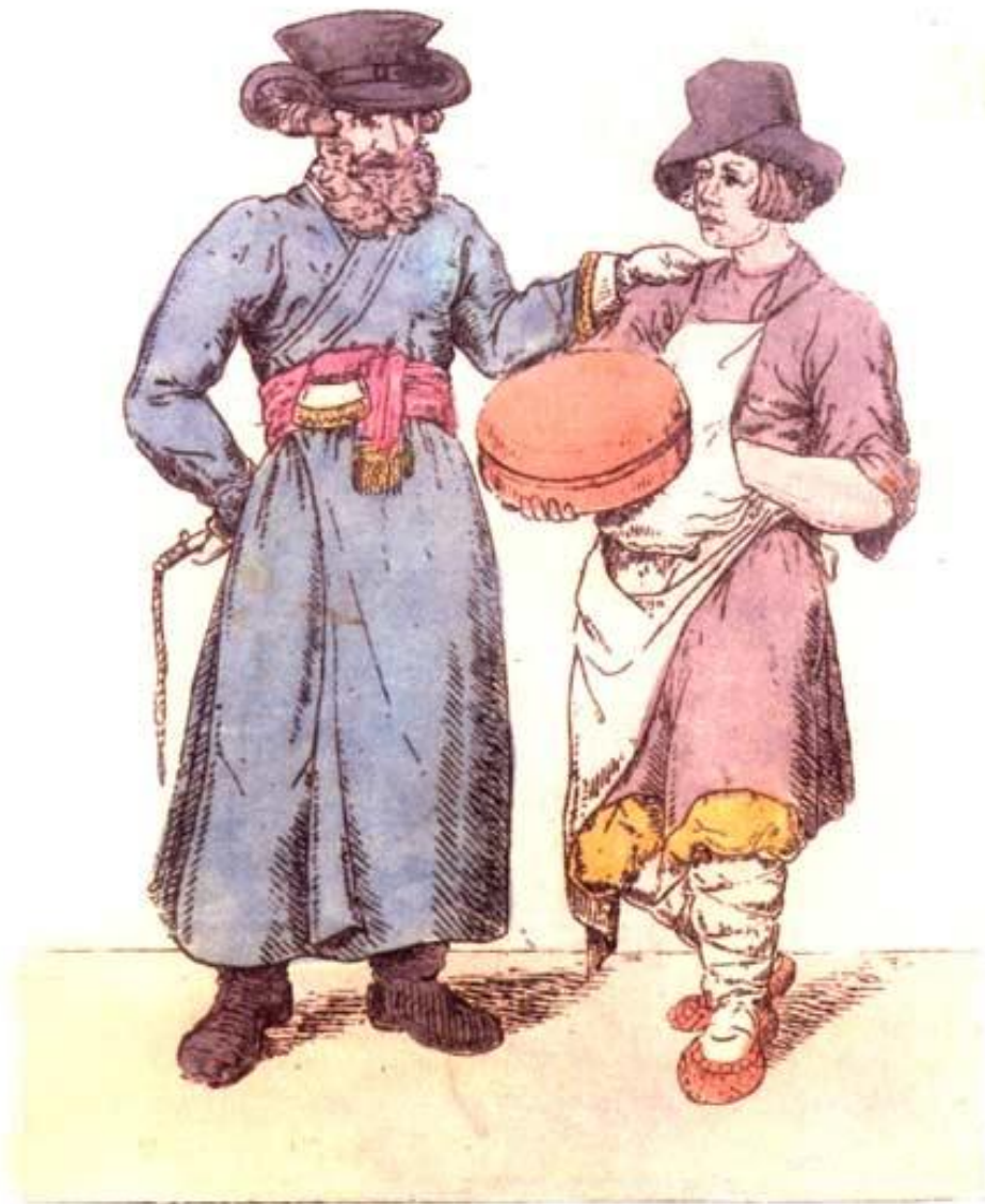
Кучеръ и Ближникъ.