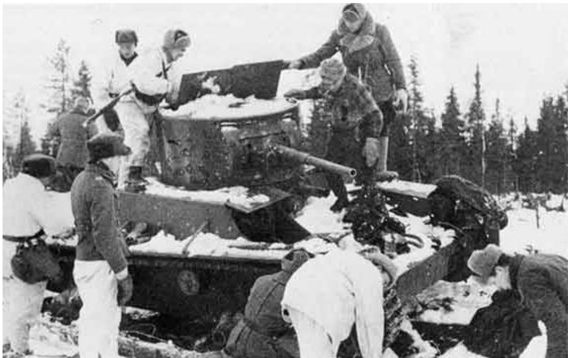
Подбитый советский танк Т-26

Бутылка с зажигательной смесью времён «Зимней войны»