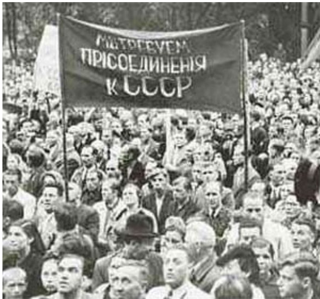
Митинги в Прибалтике с требованием присоединения к СССР.

Возникшие в Эстонии, Латвии и Литве «народные правительства» вскоре обратились к Советскому Союзу с просьбой о вхождении в состав СССР в качестве союзных республик