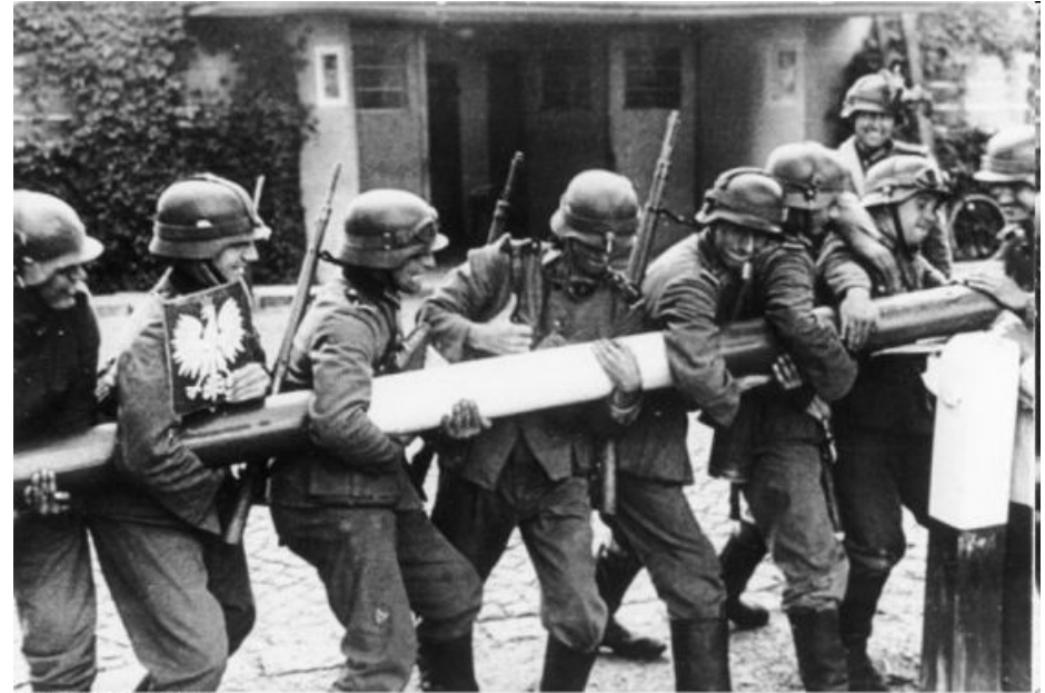
1. September 1939

Польские войска были быстро разбиты, правительство бежало из столицы.