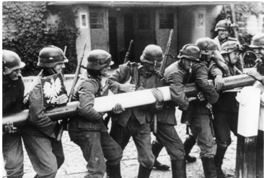
1. September 1939

Польские войска были быстро разбиты, правительство бежало из столицы.