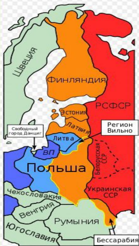
Действительные территориальные изменения в 1939 — 1940