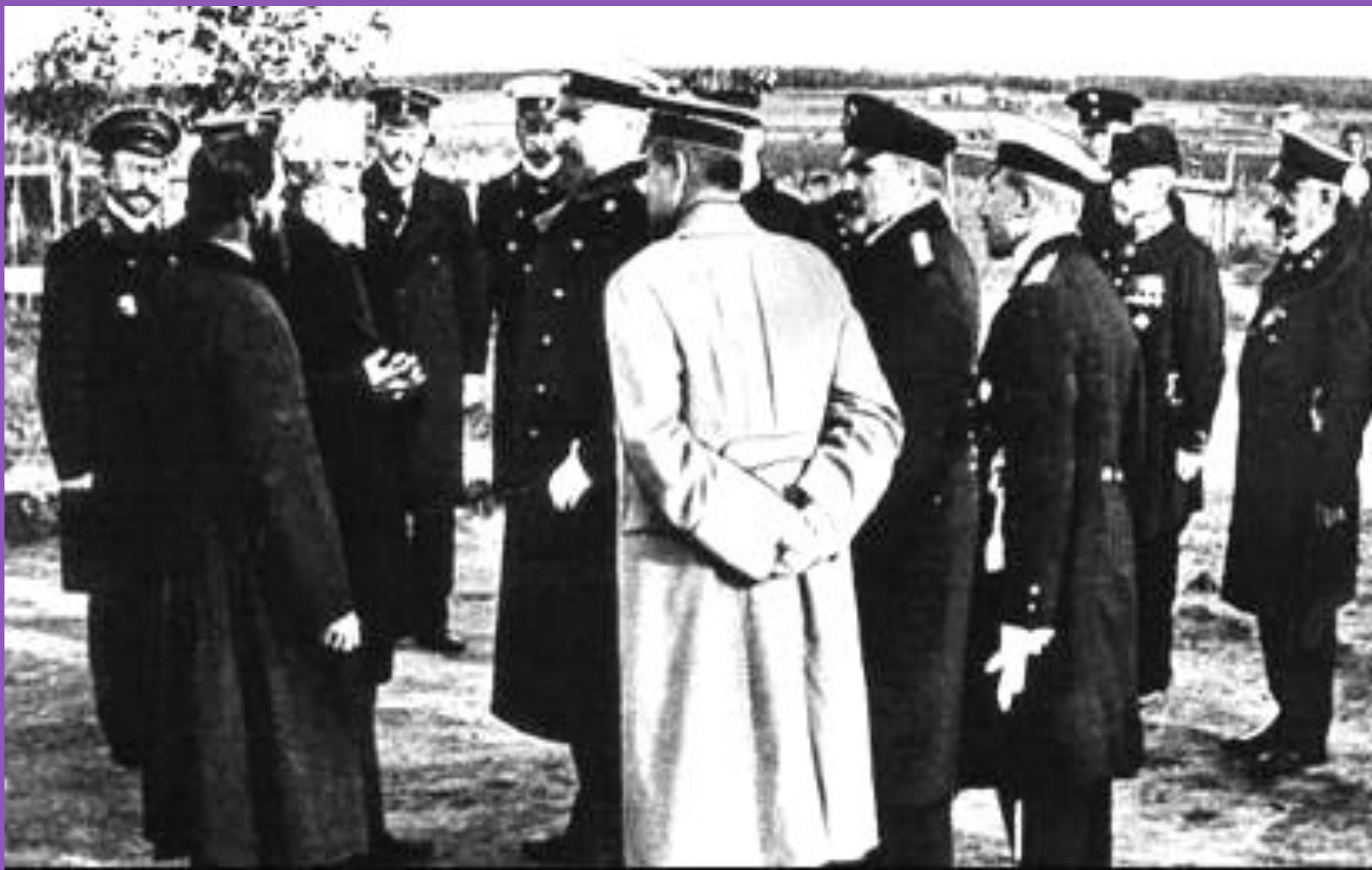
П. А. Столыпин в гостях у кулака.