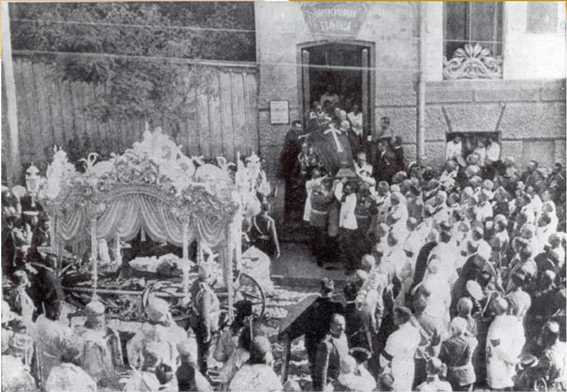
Виносъ тѣла П. А. Столыпина изъ больницы бр. Маковскихъ.