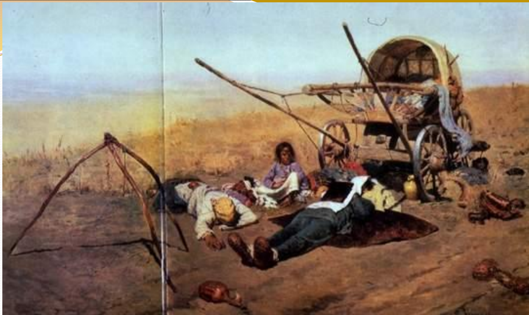
«В дороге...смерть переселенца»