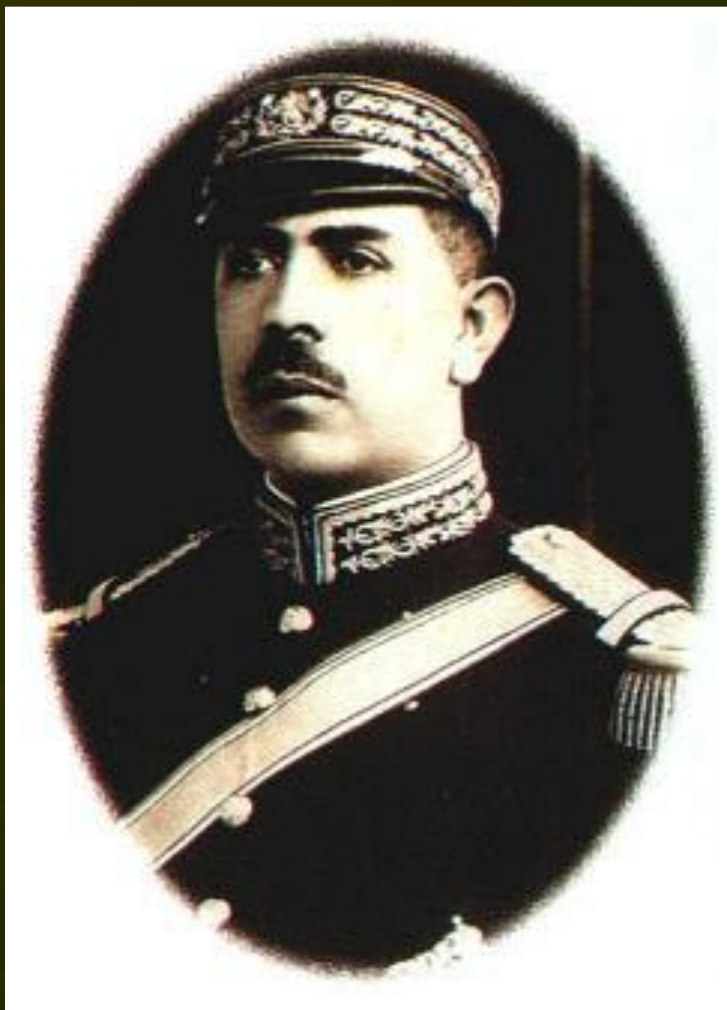
Ласаро Карденас Президент Мексики

В Великобритании 2-ы к власти приходили лейбористы, но преодолеть трудности они не смогли и в сер. 30-х гг. к власти возвратились консерваторы.