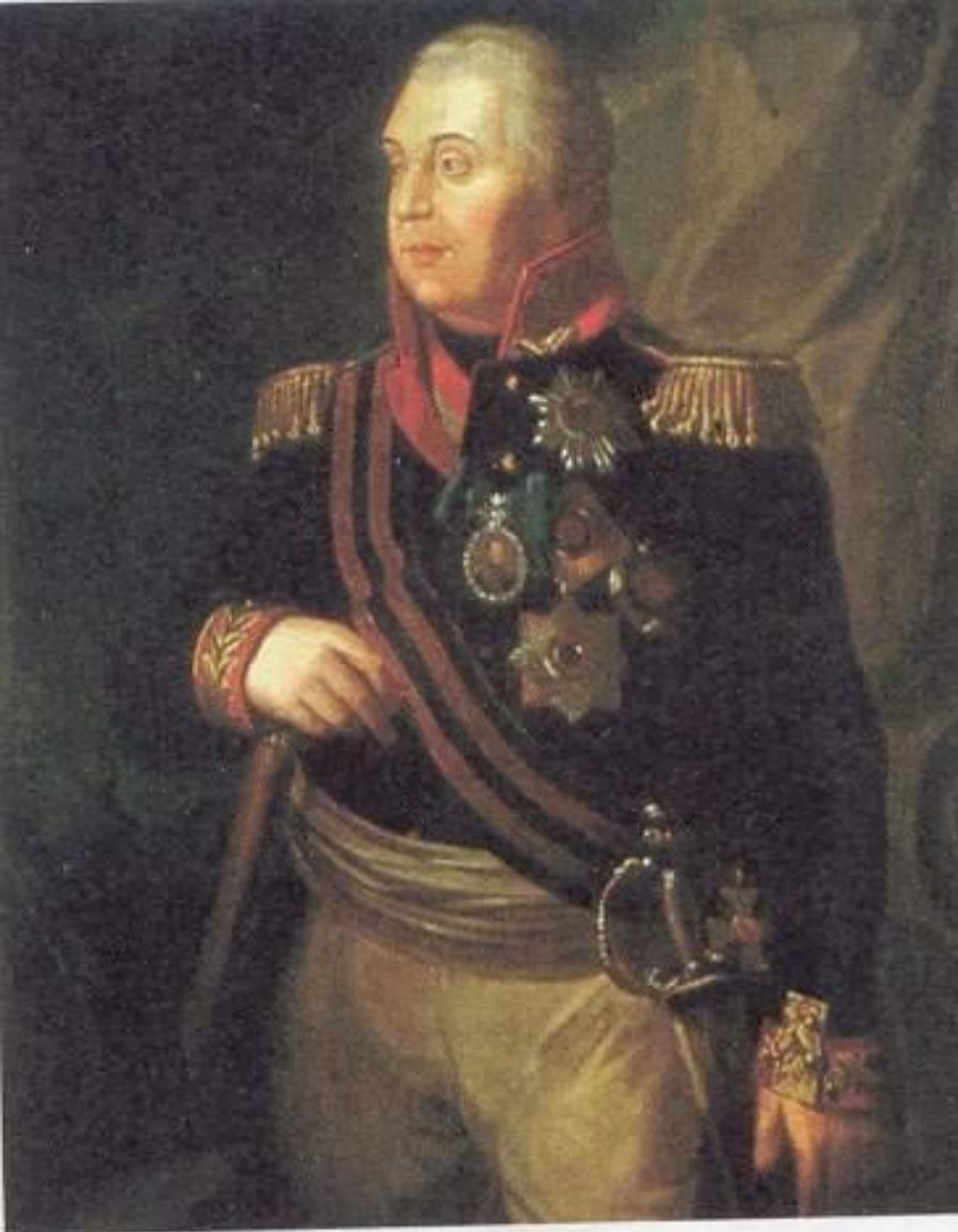
М. И. Кутузов, главнокомандующий русской армией в Отечественной войне 1812 г. (20.08.1812—16.04.1813)

Однако планы русского генерального штаба реализовать не удалось. В условиях быстрого продвижения неприятеля был избран единственно верный образ действий - любой ценой сохранить войска и, не вступая в генеральное сражение, соединить силы 1-ой и 2-ой армий. С огромным трудом удалось осуществить соединение войск.