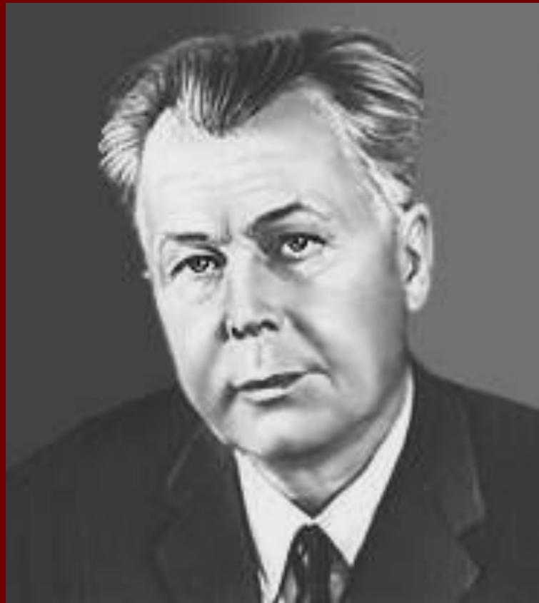
А. Твардовский «Василий Тёркин»