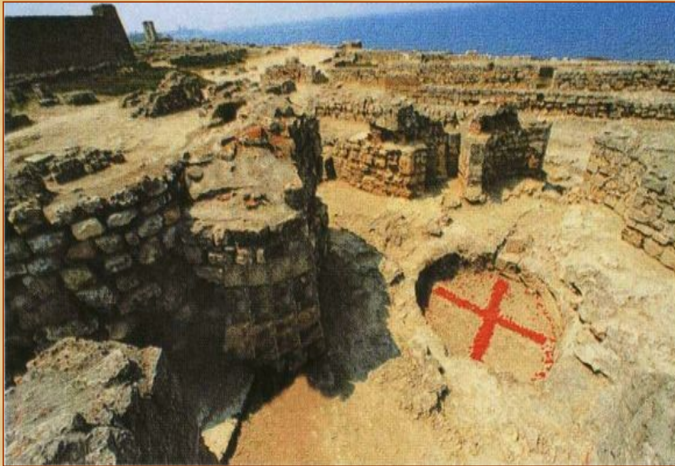
Купель баптистерия, где принял крещение князь Владимир. Раскопки в Херсонесе (Корсуни)

В назначенный день произошло массовое крещение киевлян у места впадения в Днепр реки Почайны.