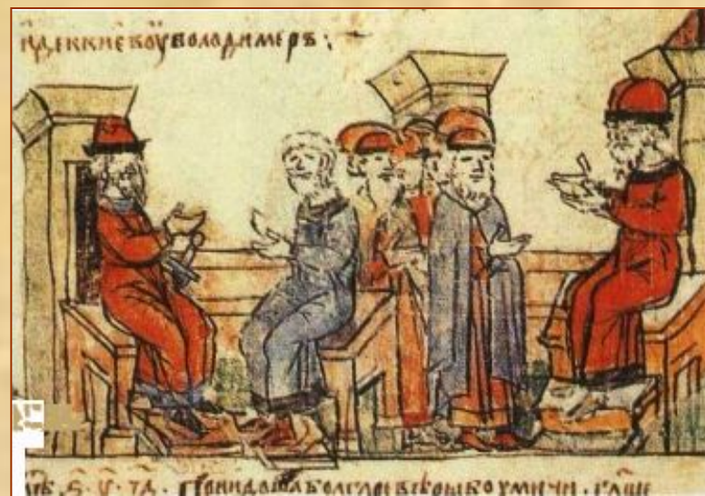
Изложение своей веры князю Владимиру мусульманами