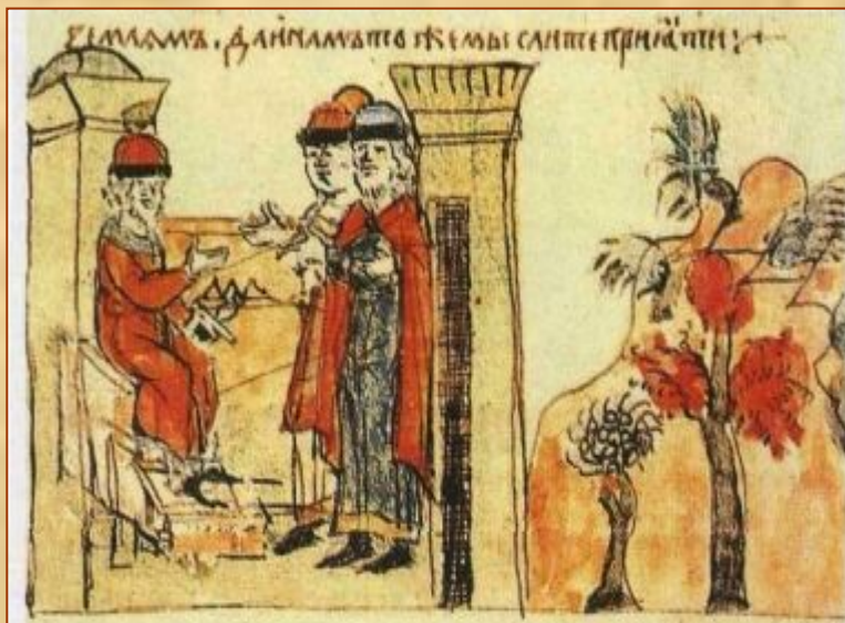
Изложение князю Владимиру своей веры хазарами