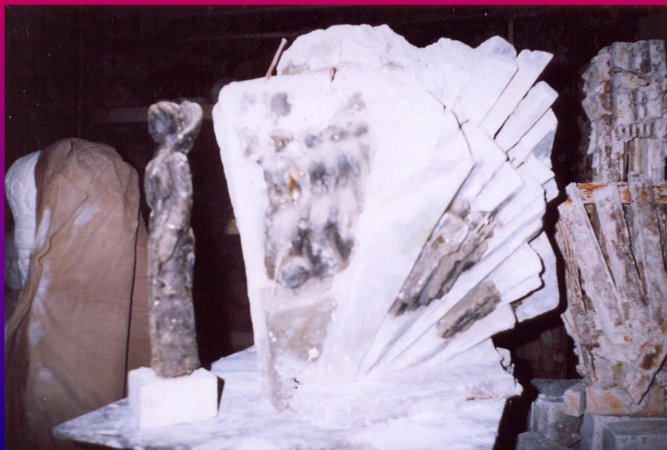
Макет памятника в мастерской скульптора Д.Ф. Горина

По замыслу авторов эту композицию должна была объединять скульптура РОДИНЫ-МАТЕРИ, стоящая перед самым памятником, но в процессе творческого поиска её заменили лавровым венком, который символизирует силу и славу воинства.