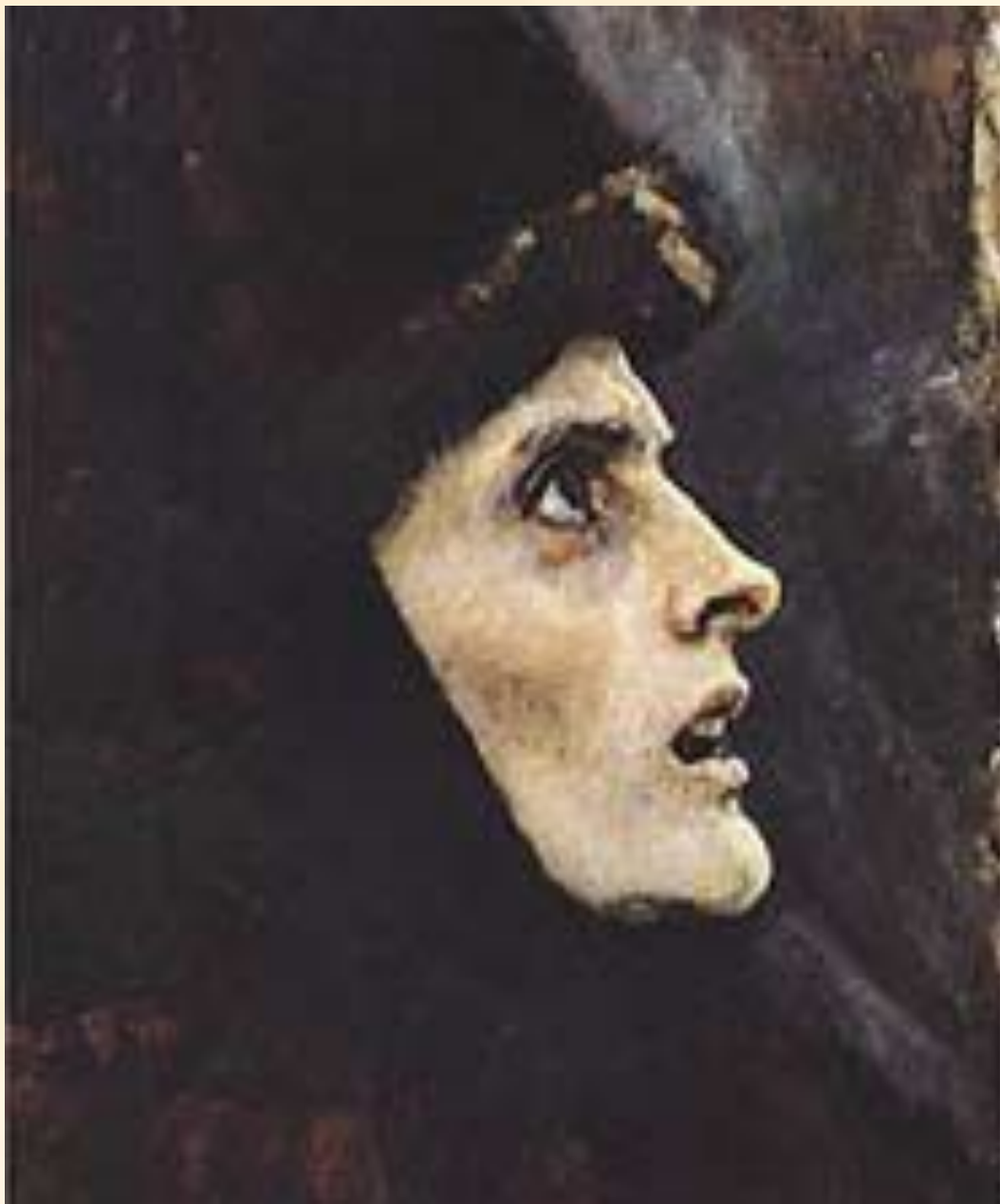
В. И. Суриков. Голова боярыни Морозовой. 1886 год.