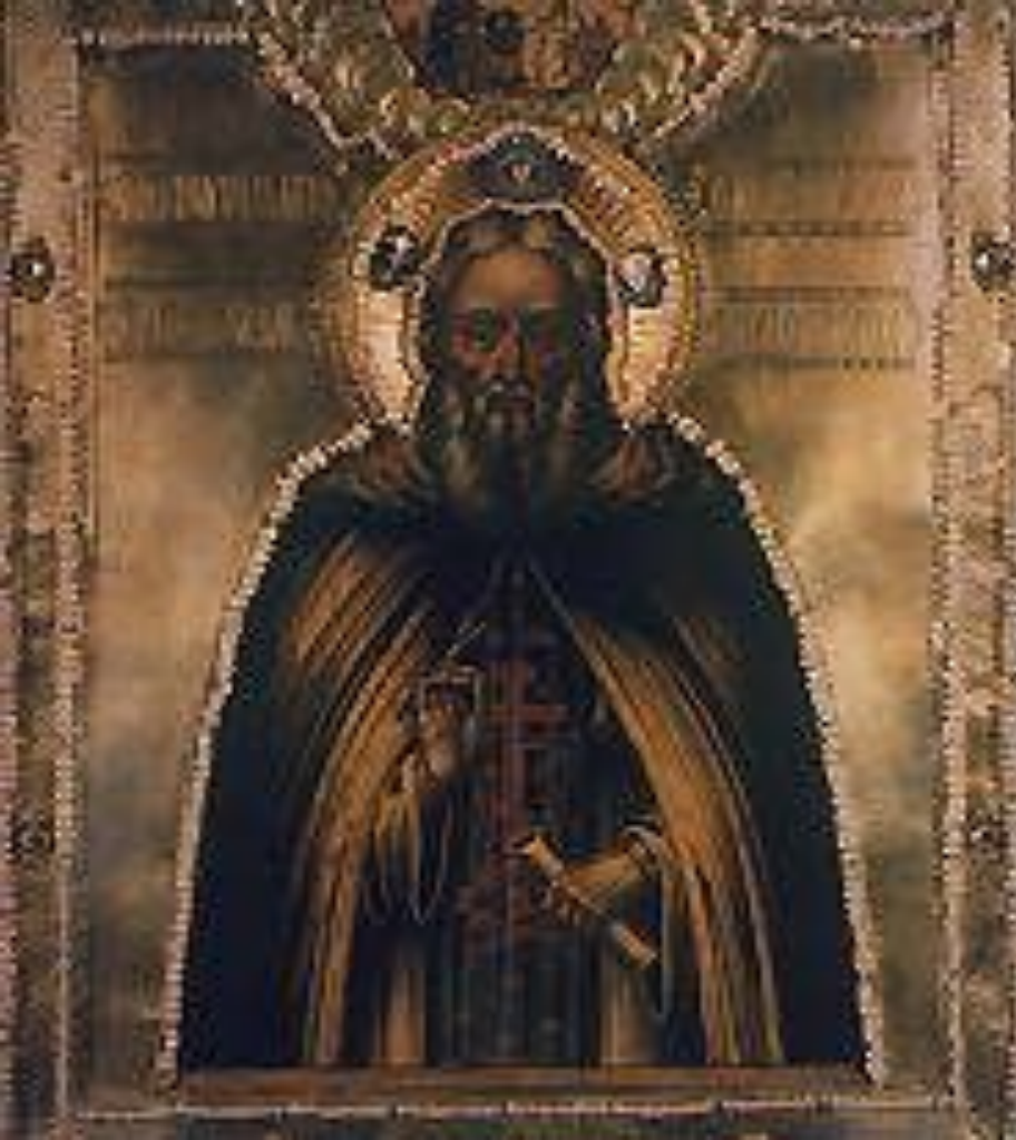
Икона «Преподобный Сергий Радонежский». 18 в.