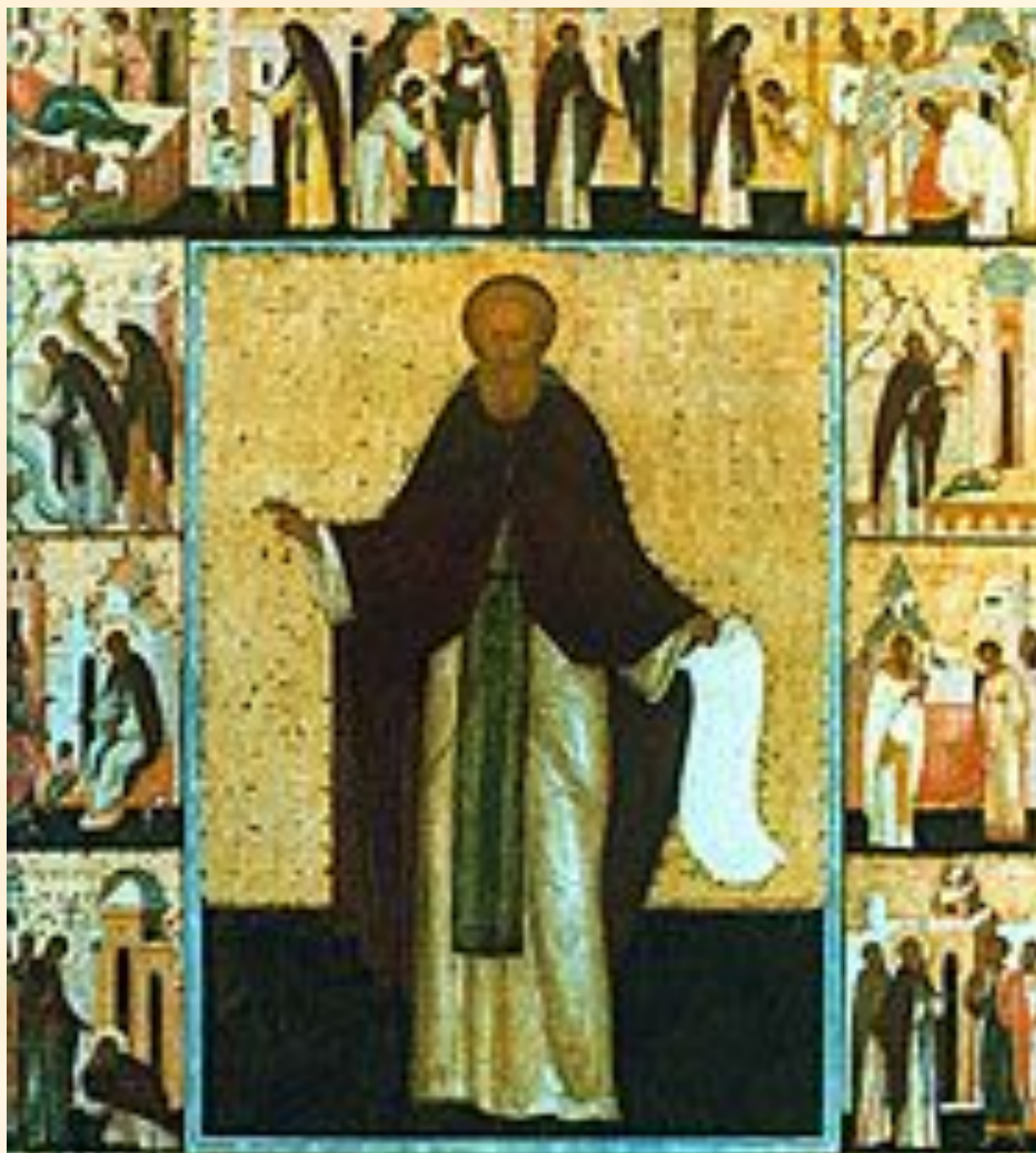
Дионисий. Деяния Сергия Радонежского. Икона из Успенского собора в Дмитрове. Вторая половина 15 века.