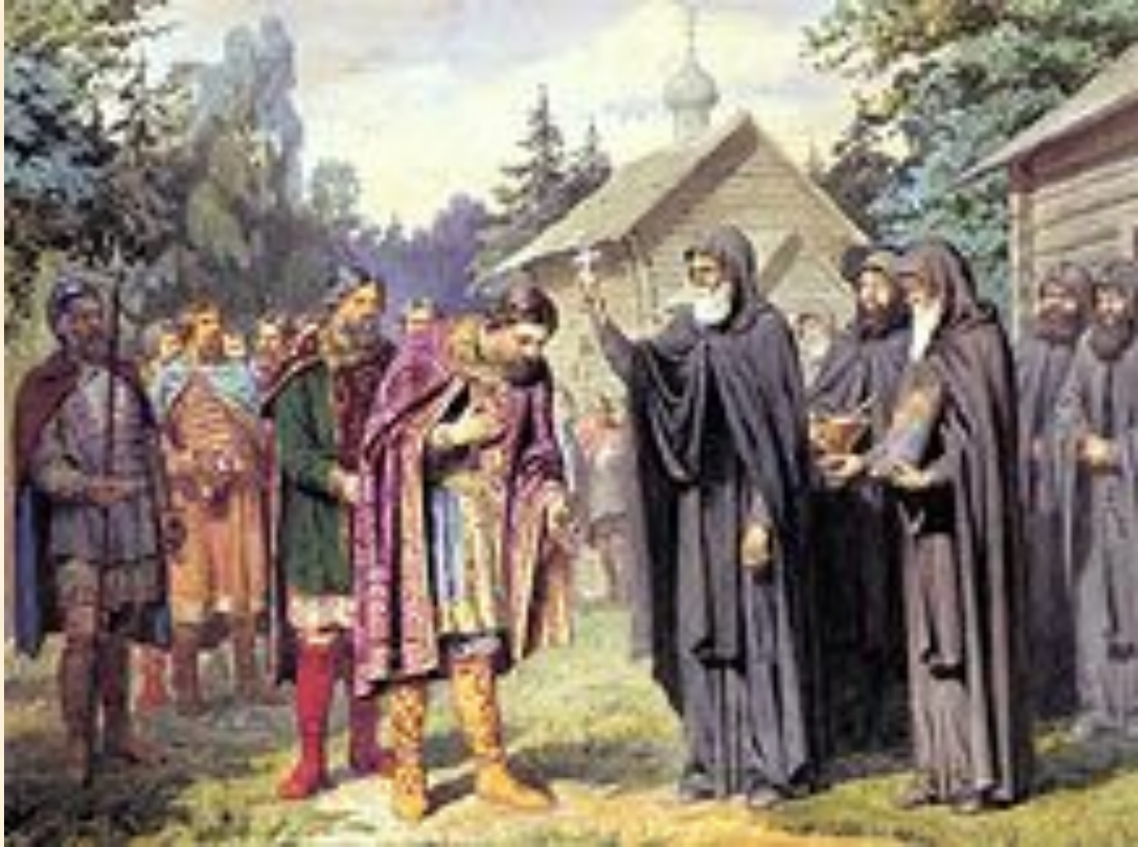
А. Д. Кившенко. «Посещение великим князем Дмитрием Сергия Радонежского перед выступлением в поход на татар. 1380 год». 1880.