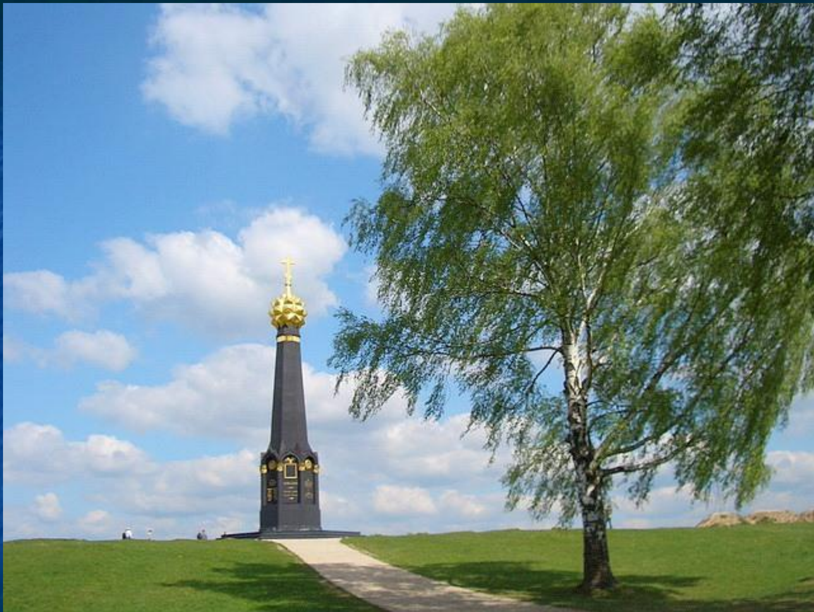
Курганная высота (Батарея Раевского)