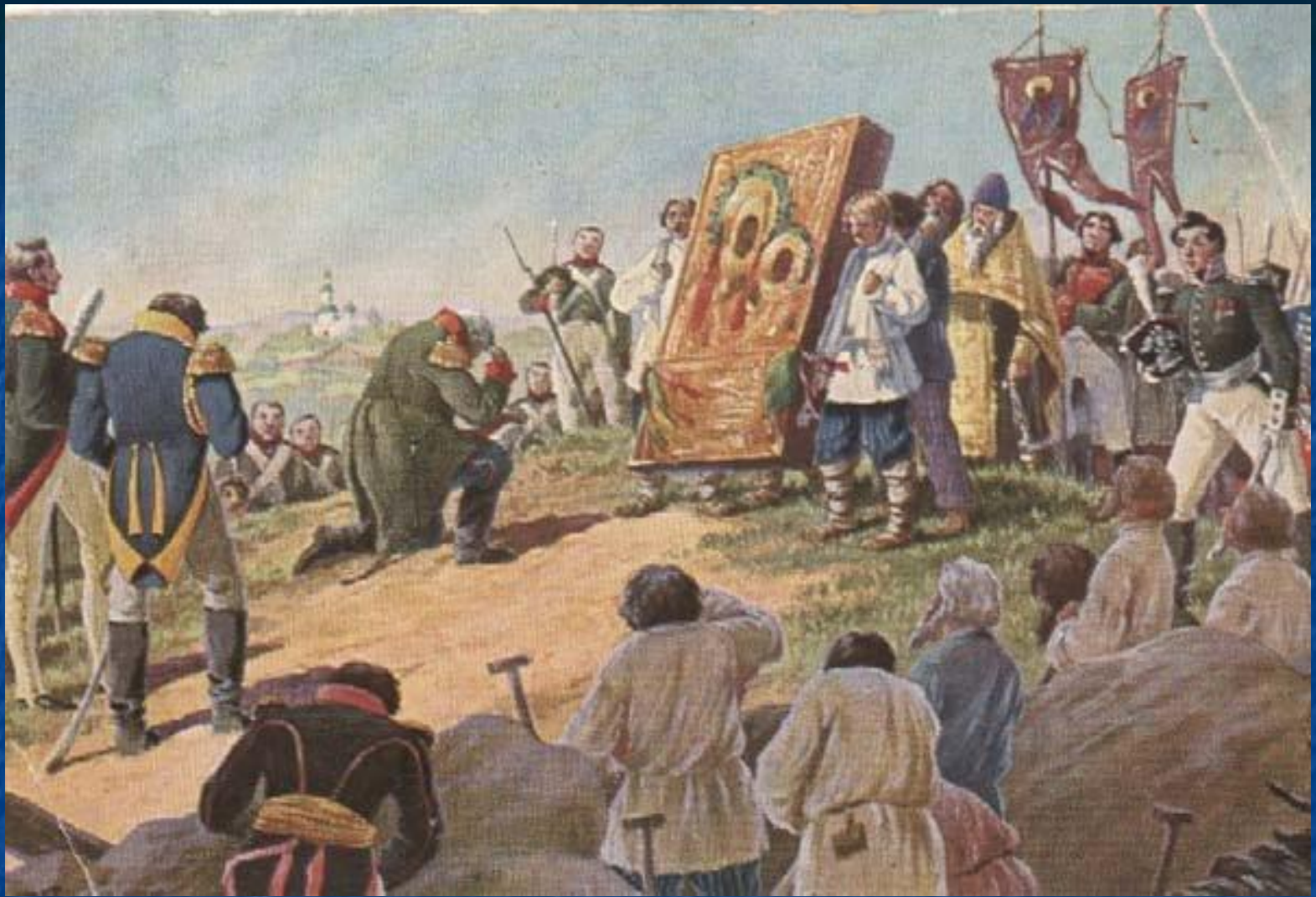
Молебен иконе Божией Матери Смоленской перед Шевардинской битвой