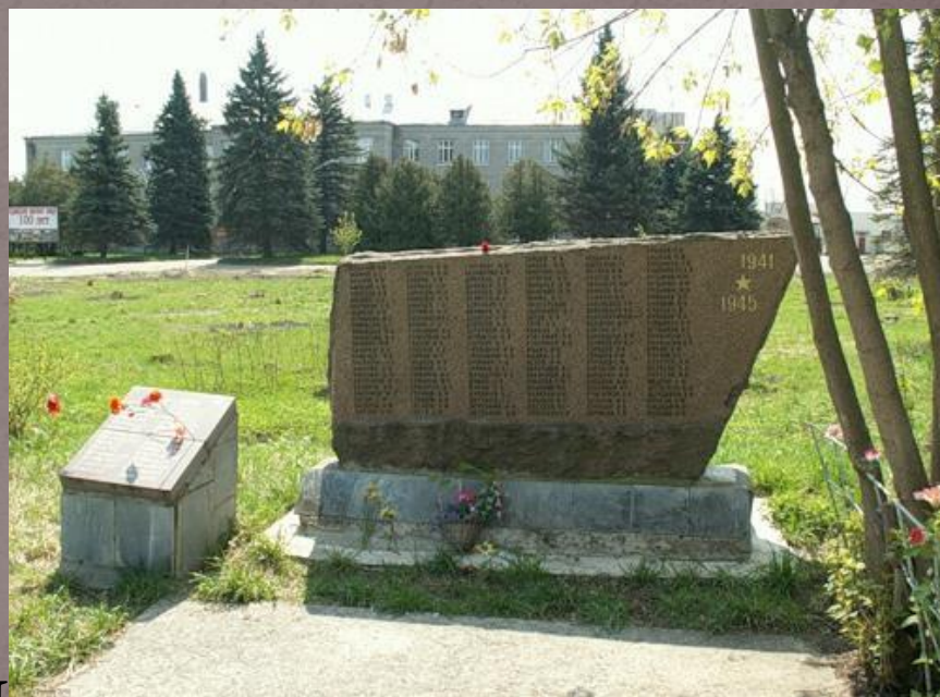
Памятники погибшим в годы ВОВ п. Редкино