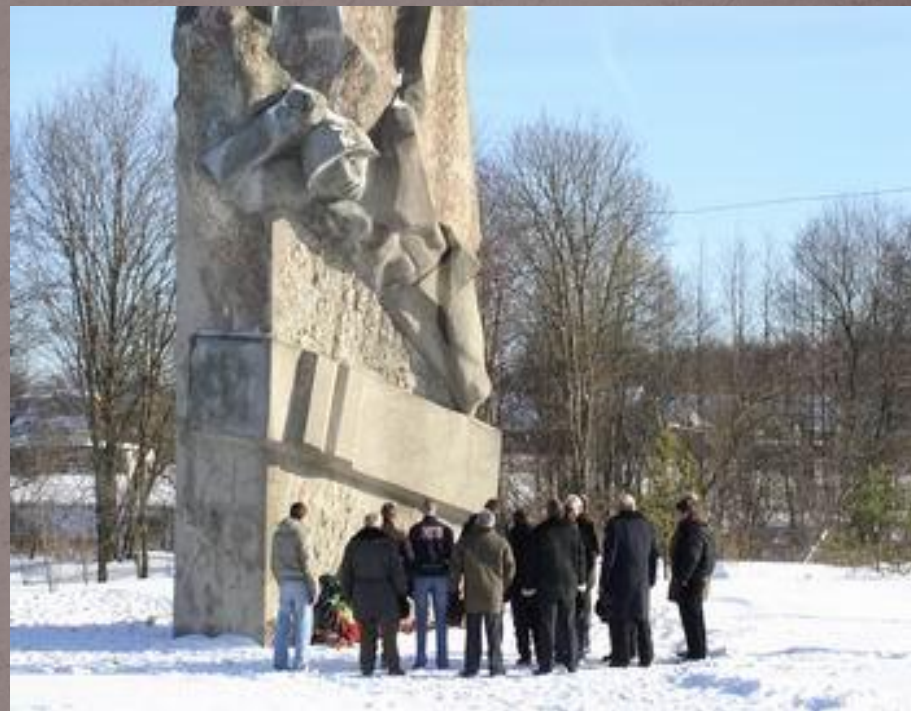
Памятник В. Васильковскому у д. Рябинки