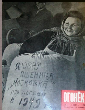
Фото из экспозиции Конаковского Краеведческого музея