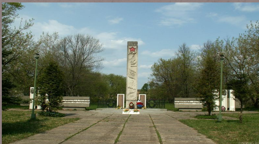
п. Озерки. Могила Героя Советского Союза А.С. Шаталкина, мемориал воинам и памятник неизвестному летчику.