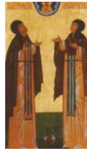
Пётр и Феврония Муромские