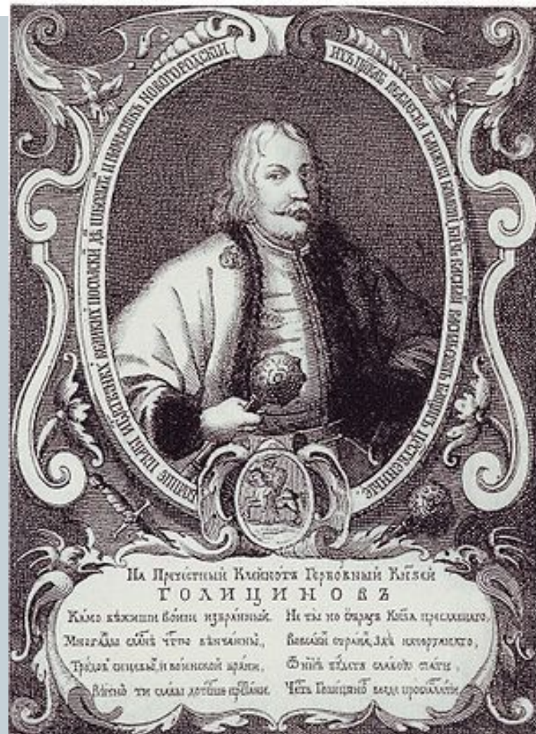
Фаворит Софьи князь В.В. Голицин