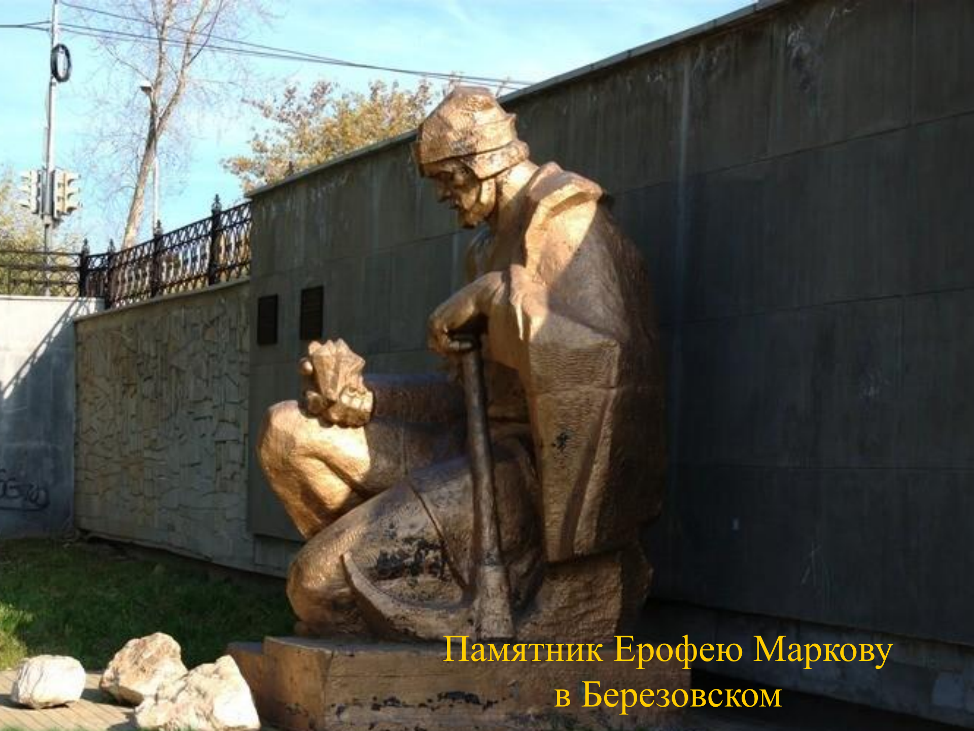
Памятник Ерофею Маркову в Березовском