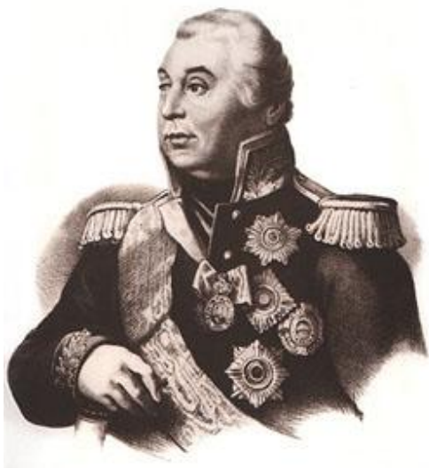
М.И.Кутузов на Бородинском поле