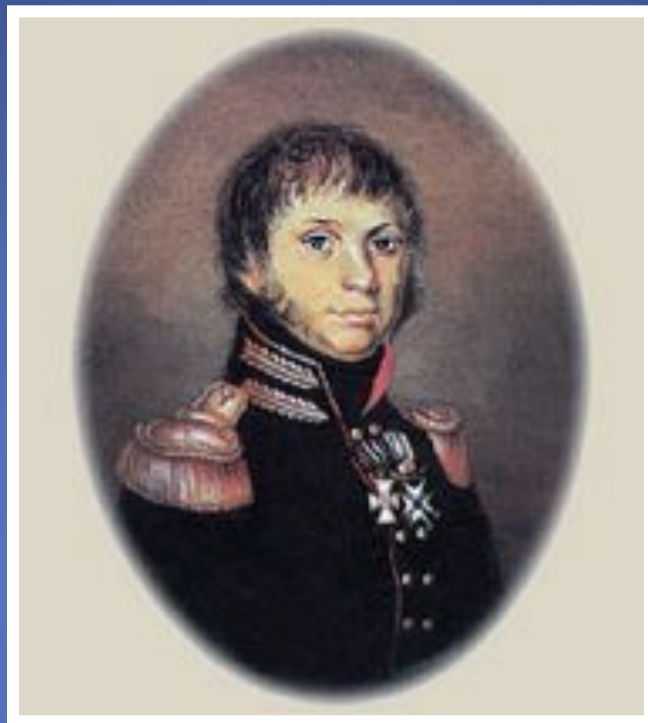
Александр Самойлович Фигнер