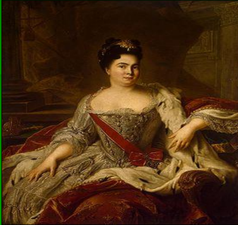
ЕКАТЕРИНА I (Марта Скавронская)