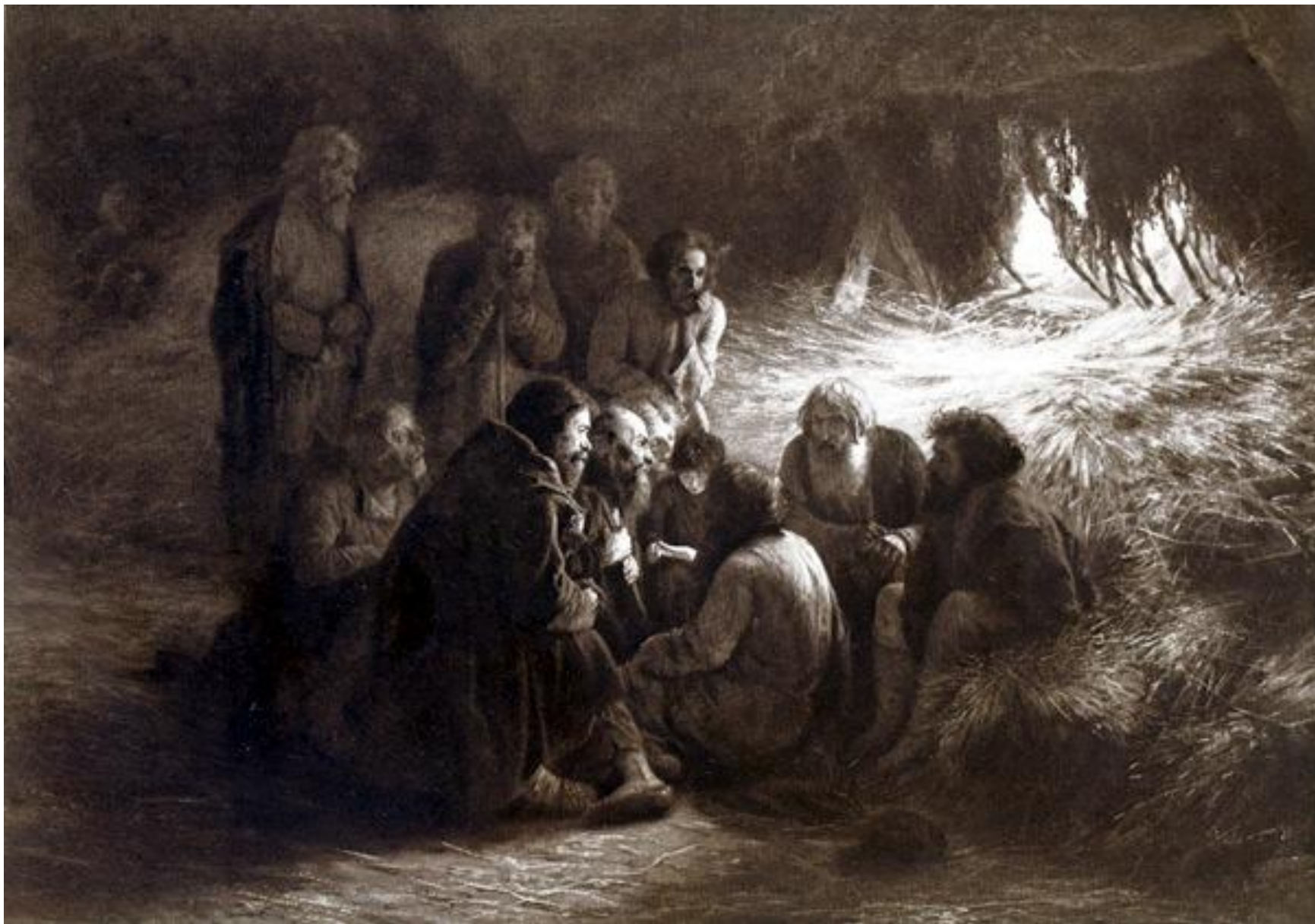
Г.Г. Мясоедов. Чтение манифеста 19 февраля 1861 г.