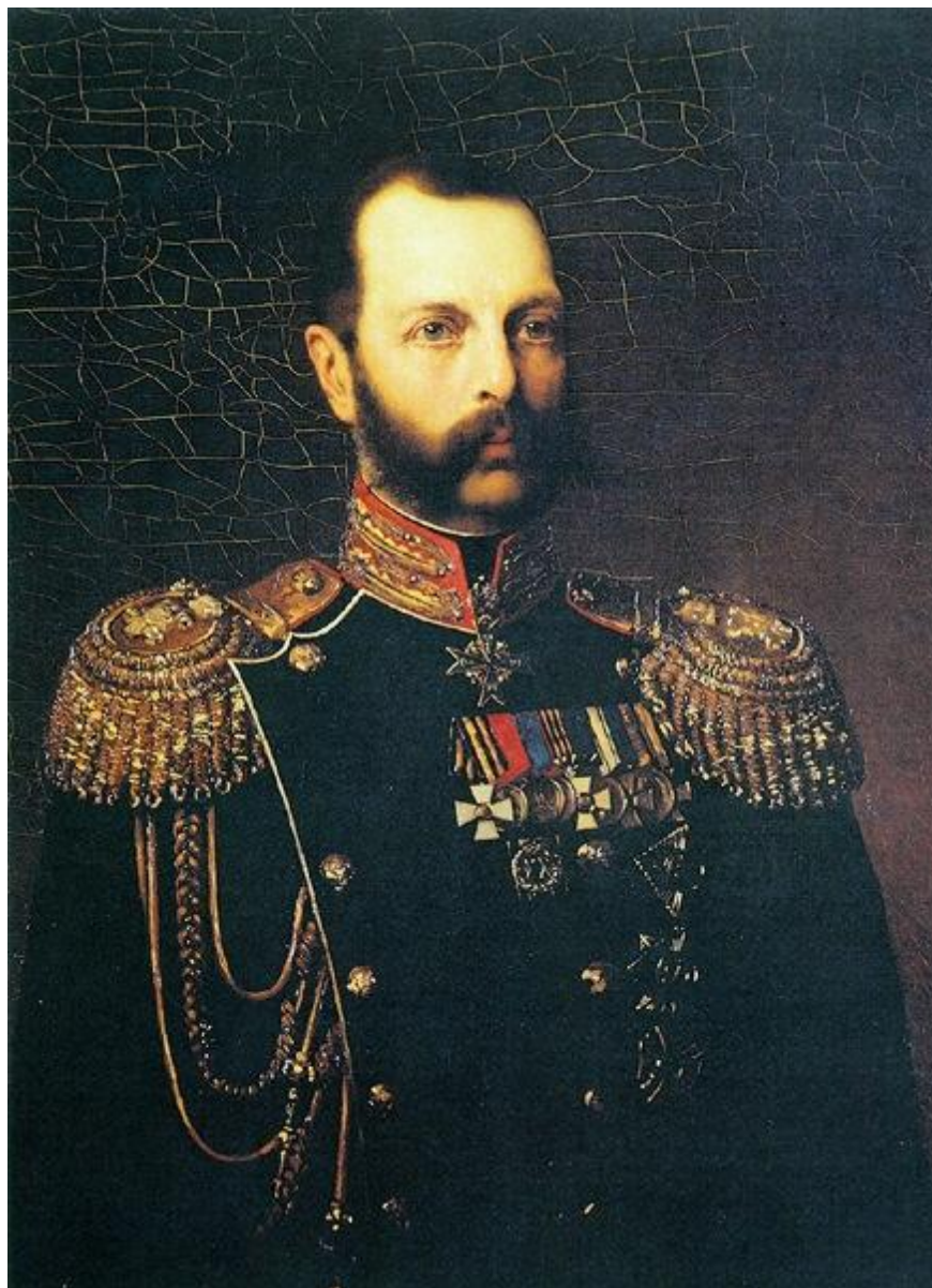
Александр II (1855 – 1881)