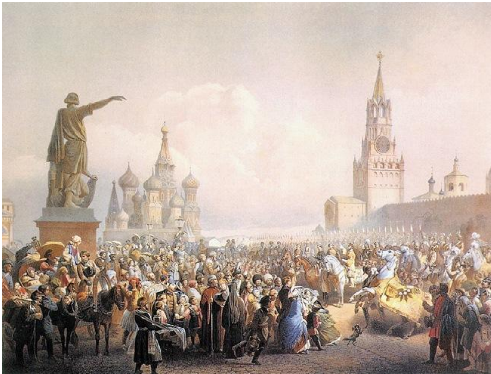
В.С. Садовников. Провозглашение о коронации Александра II на Красной площади