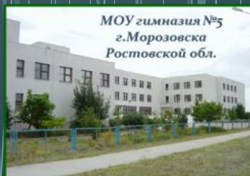
МОУ гимназия №5 г. Морозовска Ростовской обл.