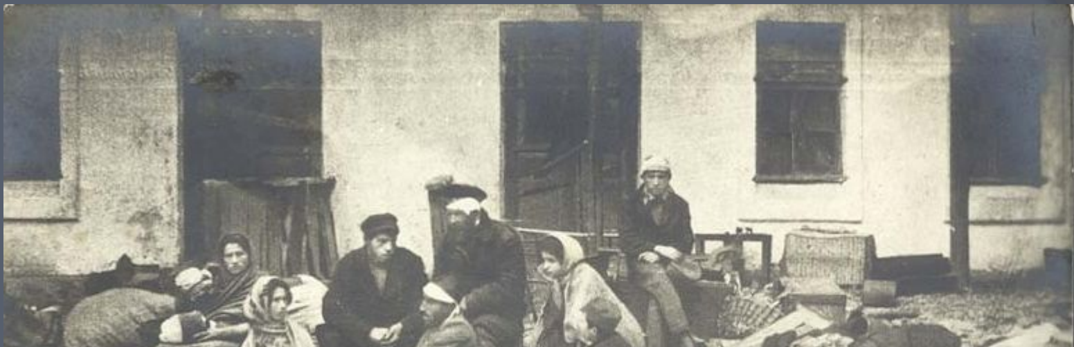
ПОСЛЕ ПОГРОМА ВЪ ОДЕССЕ