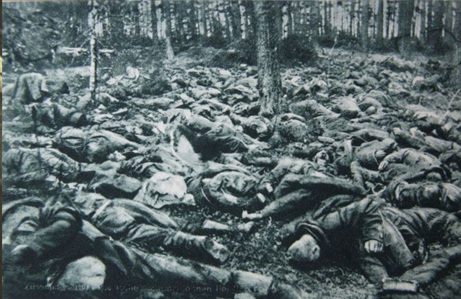
zuzsoidesatit die 10ne scandinolen der 20ne