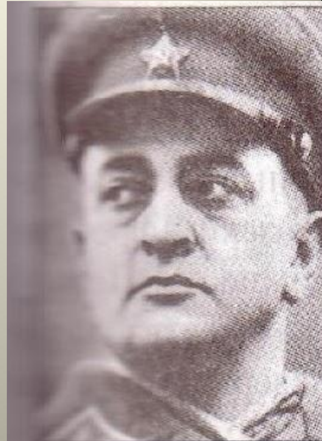
М. Н. Тухачевский