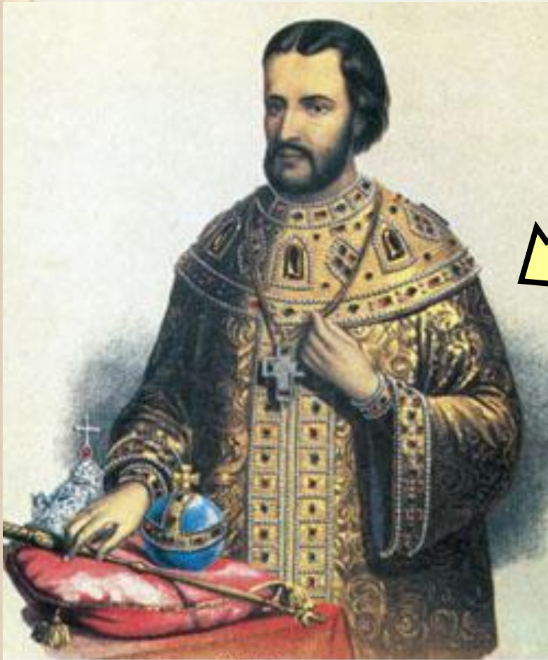
Иоанн V Алексеевич (1666-1696)