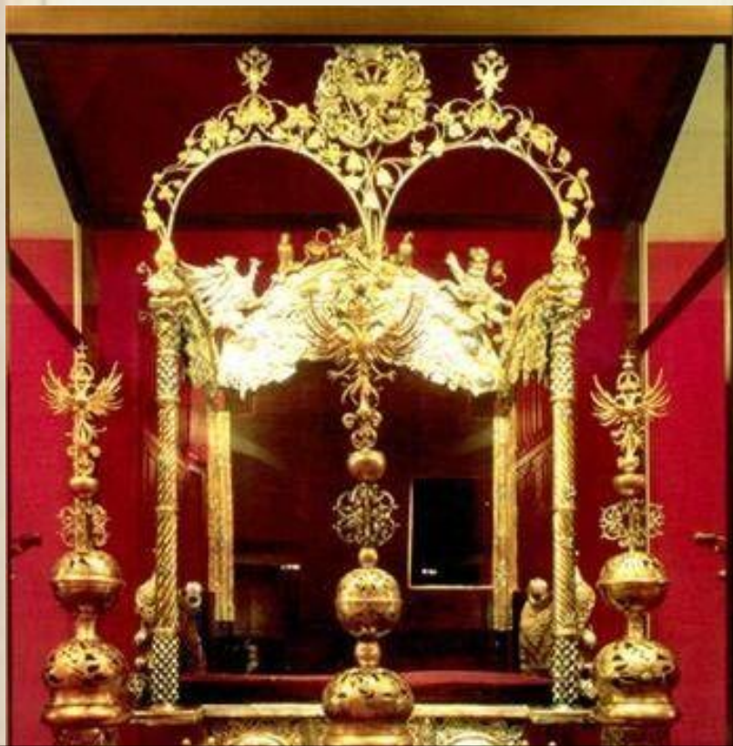
Двойной трон в Оружейной палате