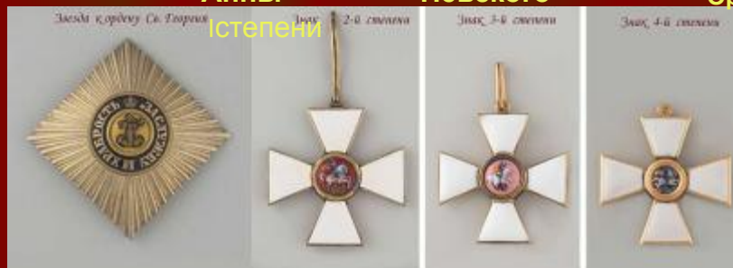
Орден Святого Георгия