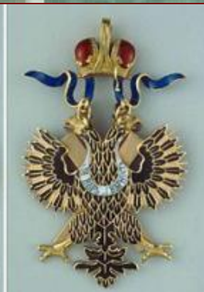
орден Святого Владимира