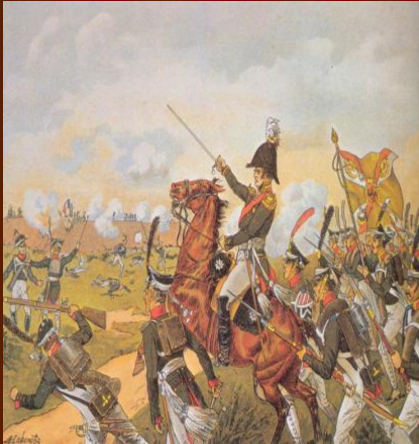
Хромофотография А. Сафонова

Контратака Алексея Ермолова на захваченную батарею Раевского в ходе Бородинского сражения. ■