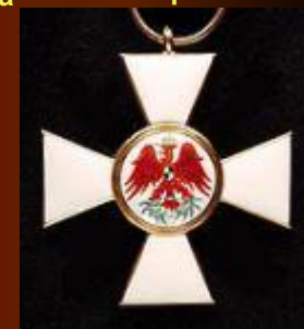
Орден Красного орла