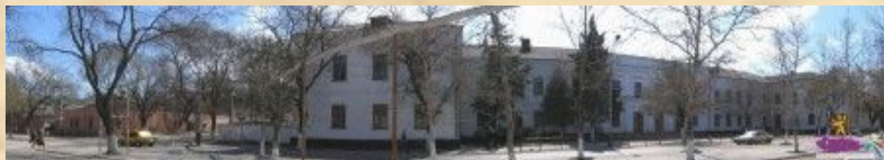
Здание средней школы им. Володи Дубинина (ул.Пирогова, 8 "а").