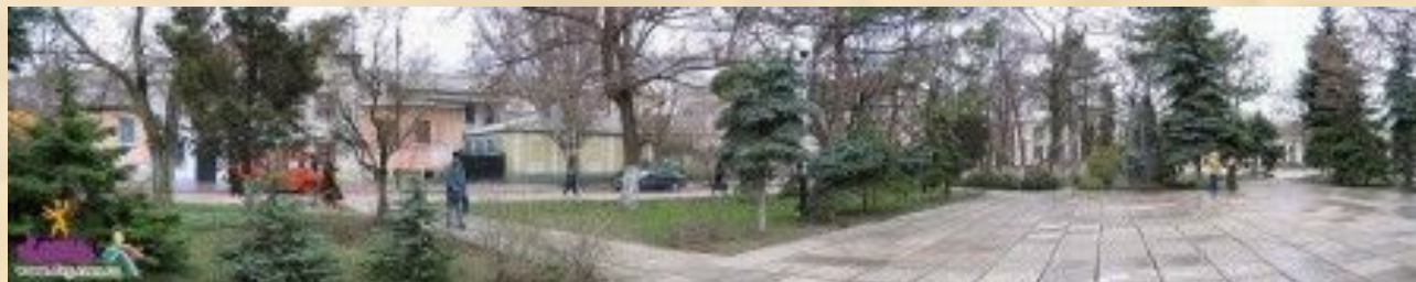
Пионерский сквер. Памятник Володе Дубинину.