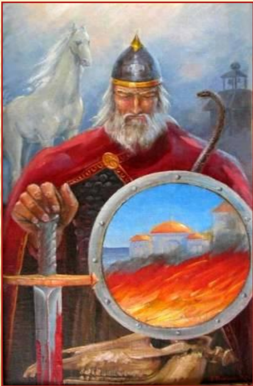
Восхождение князя Олега