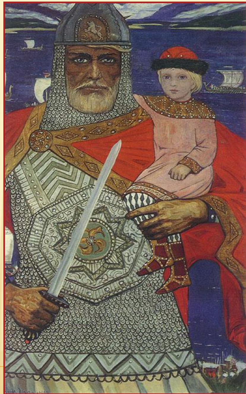
Князь Олег с маленьким Игорем