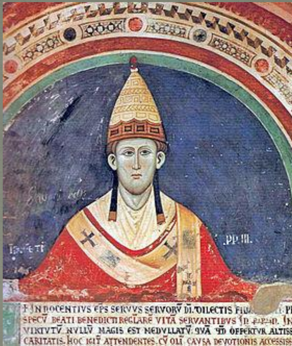
Письмо папы Иннокентия III Маркизу Монферратскому.