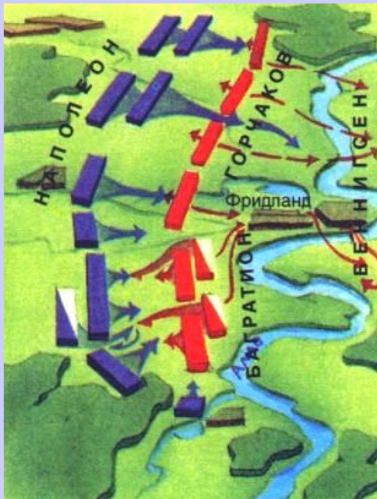
Битва под Фридрихсландом

В 1806г. Возникла 4-я коалиция-Россия, Англия, Швеция, Пруссия.