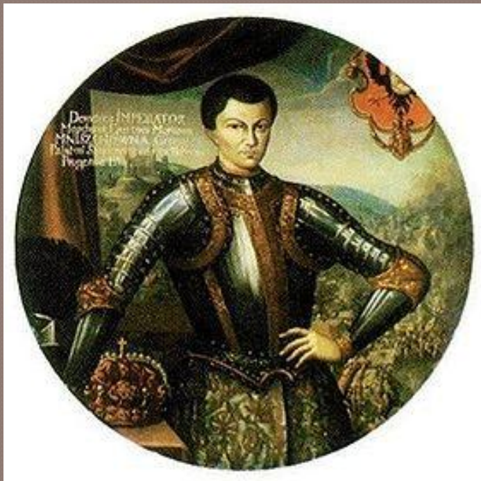
Лжедмитрий I (Дмитрий Иванович)

В 1601г. в Польско-Литовском государстве объявился самозванец, заявивший, что он – «чудом спасшийся» царевич Дмитрий. Это был беглый монах Григорий Отрепьев. Польский король и воевода Мнишек помогли Лжедмитрию собрать войско для похода в Россию.