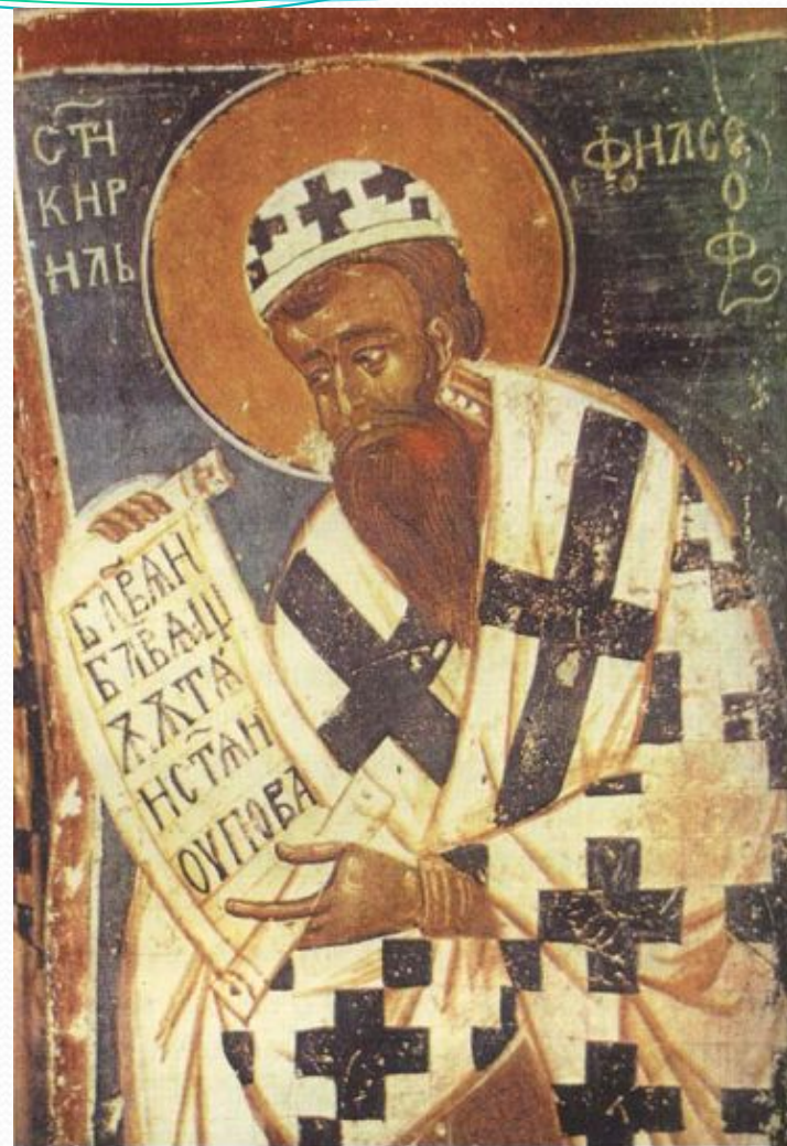
Святой Кирилл. Фреска церкви Апостола Петра. XIII в. Болгария

В Житии Константина о его образовании сообщается: «За три месяца он изучил всю грамматику и взялся за другие науки. Изучил Гомера, геометрию и у Льва и Фотия изучал диалектику и другие философские учения, кроме того — риторику, арифметику, астрономию, музыку и другие эллинские науки. И так он изучил все это, как не изучал ЭТИХ НАУК НИКТО ДРУГОЙ»