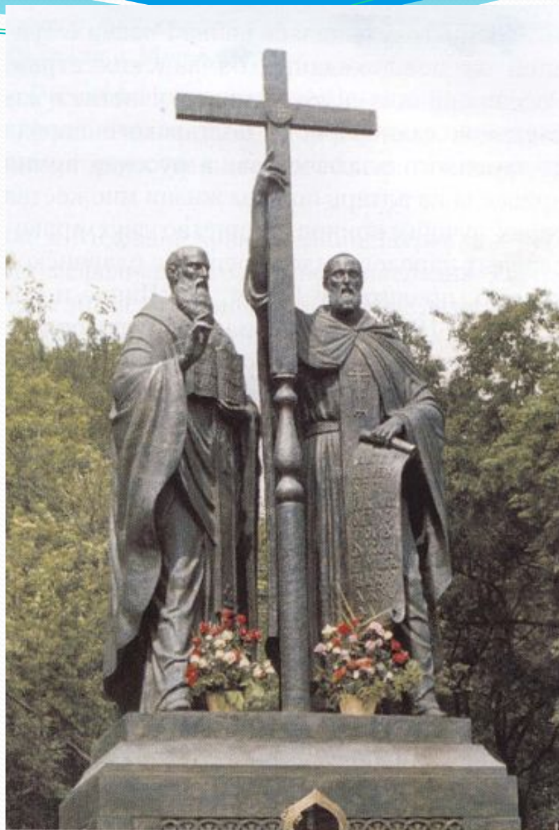
Памятник святым Кириллу и Мефодию. Скульптор В.М. Клыков. 1992 г. Москва

Начиная с 1992 года празднование Дня славянской письменности и культуры в нашей стране приобретает государственный характер. В этом году в Москве на Славянской площади был сооружен памятник святым братьям. Вот уже несколько лет 24 мая к этому памятнику направляются крестные ходы из московских храмов, а Святейший Патриарх Московский и всея Руси Алексий II совершает праздничный молебен в честь святых равноапостольных Кирилла и Мефодия.