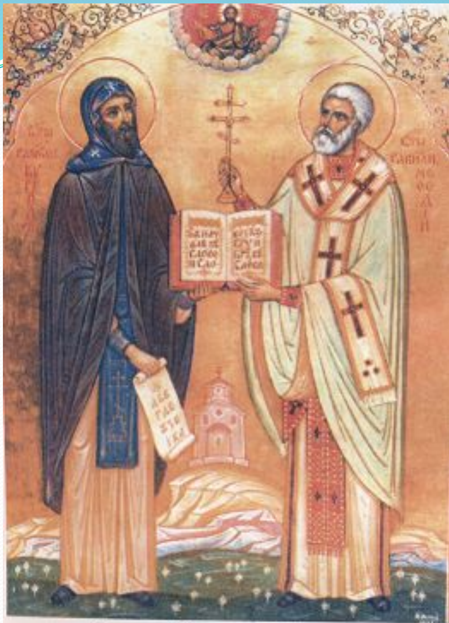
Святые Кирилл и Мефодий. Икона. 1969 г.

Если же спросить славянских грамотеев так: Кто вам письма сотворил или книги перевел, То все знают и, отвечая, говорят: Святой Константин Философ, нареченный Кириллом, — Он нам письма сотворил и книги перевел.