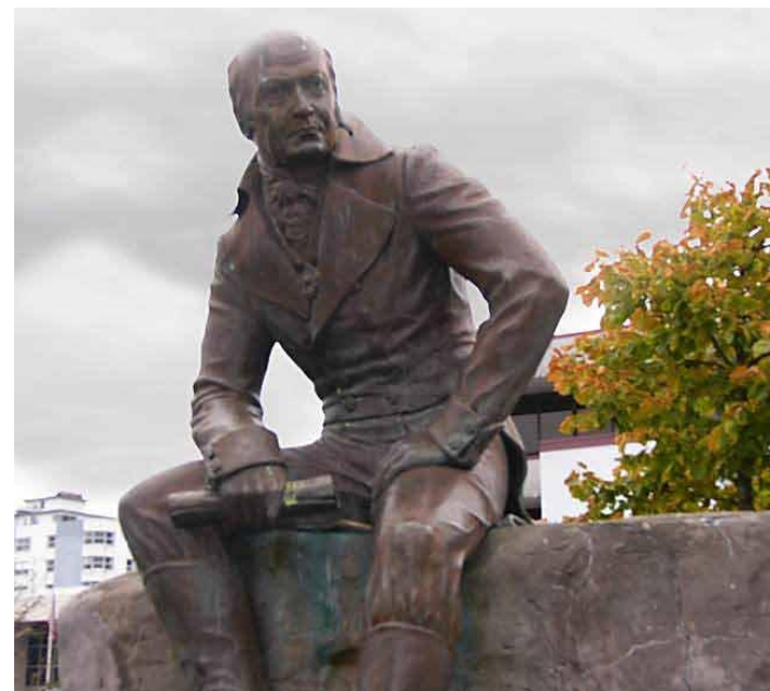
Памятник А.А. Баранову в г. Ситка (Ново-Архангельск) на Аляске

Именно А.А. Баранов в ноябре 1811 г. отправил своего помощника Ивана Андреевича Кускова (1765–1823) на шхуне «Чириков» в Калифорнию для устройства селения, в последствии получившего имя – Форт Росс