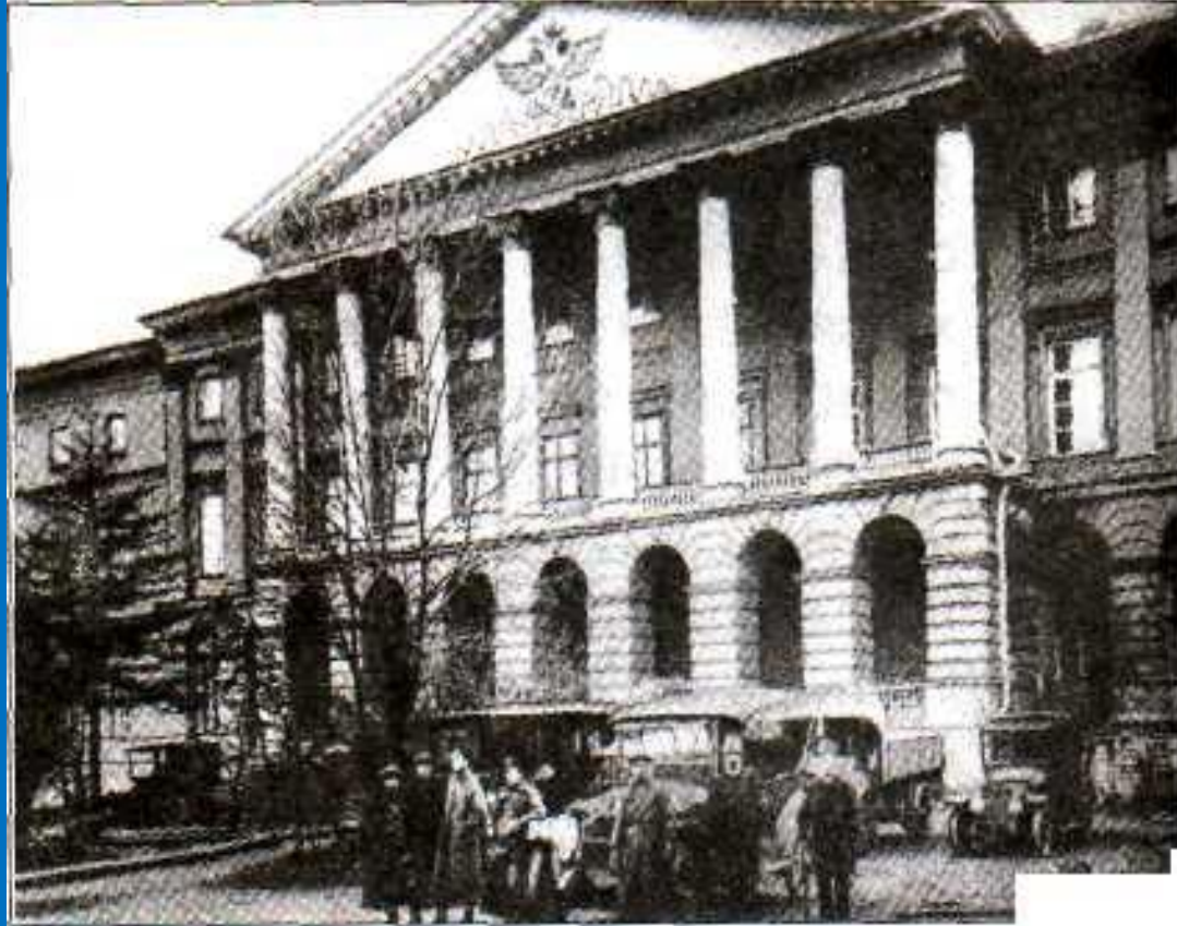
Петроград. Смольный. 1917г.

Причины: отсутствие твердой государственной власти; замедленный характер реформ; война; нарастание революционных настроений