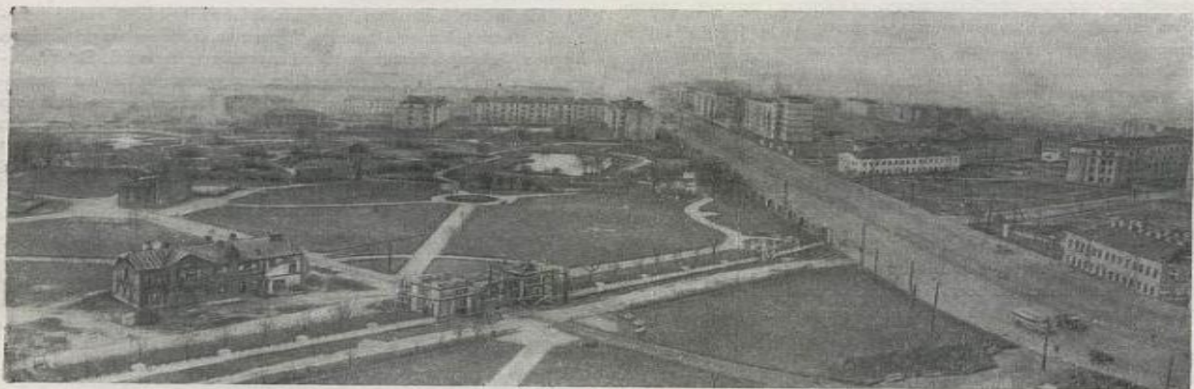
Реконструкция сада 9 Января, проведенная в 1945—1947 гг. Авторы проекта — архитекторы В. А. Каменский и А. В. Модзалевский.