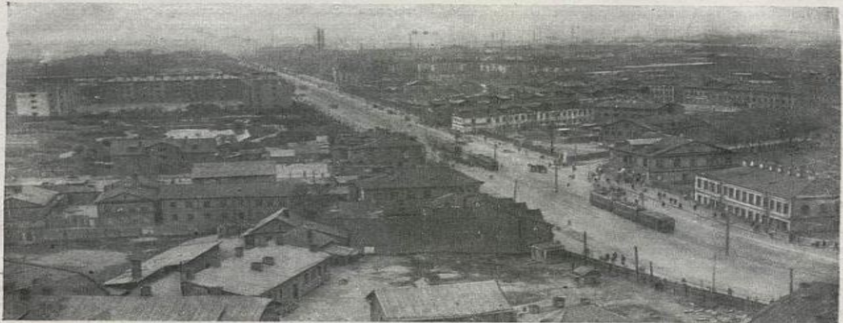
Сад 9 Января в Кировском районе в довоенное время.