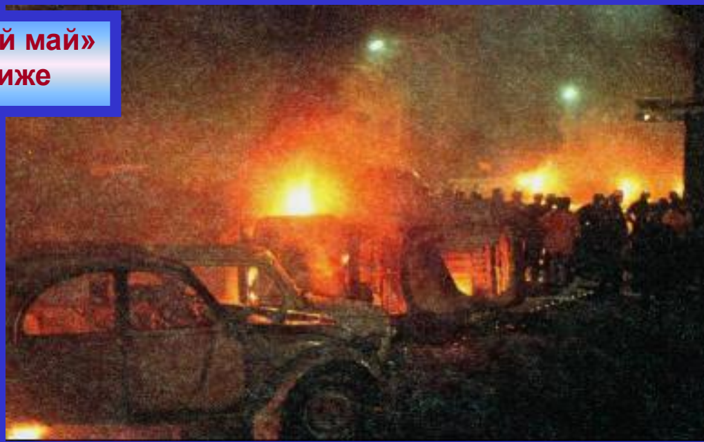
«Красный май» в Париже

Мощные выступления студентов прошли по всей Франции. Безработица среди молодёжи, авторитарные порядки в студенческих городках привели к социальному взрыву. В начале мая 1968 г. была разогнана студенческая демонстрация. В ответ студенты заняли Латинский квартал Парижа. Их лидер, Кон-Бендит призвал к решительной борьбе с капиталистической системой.